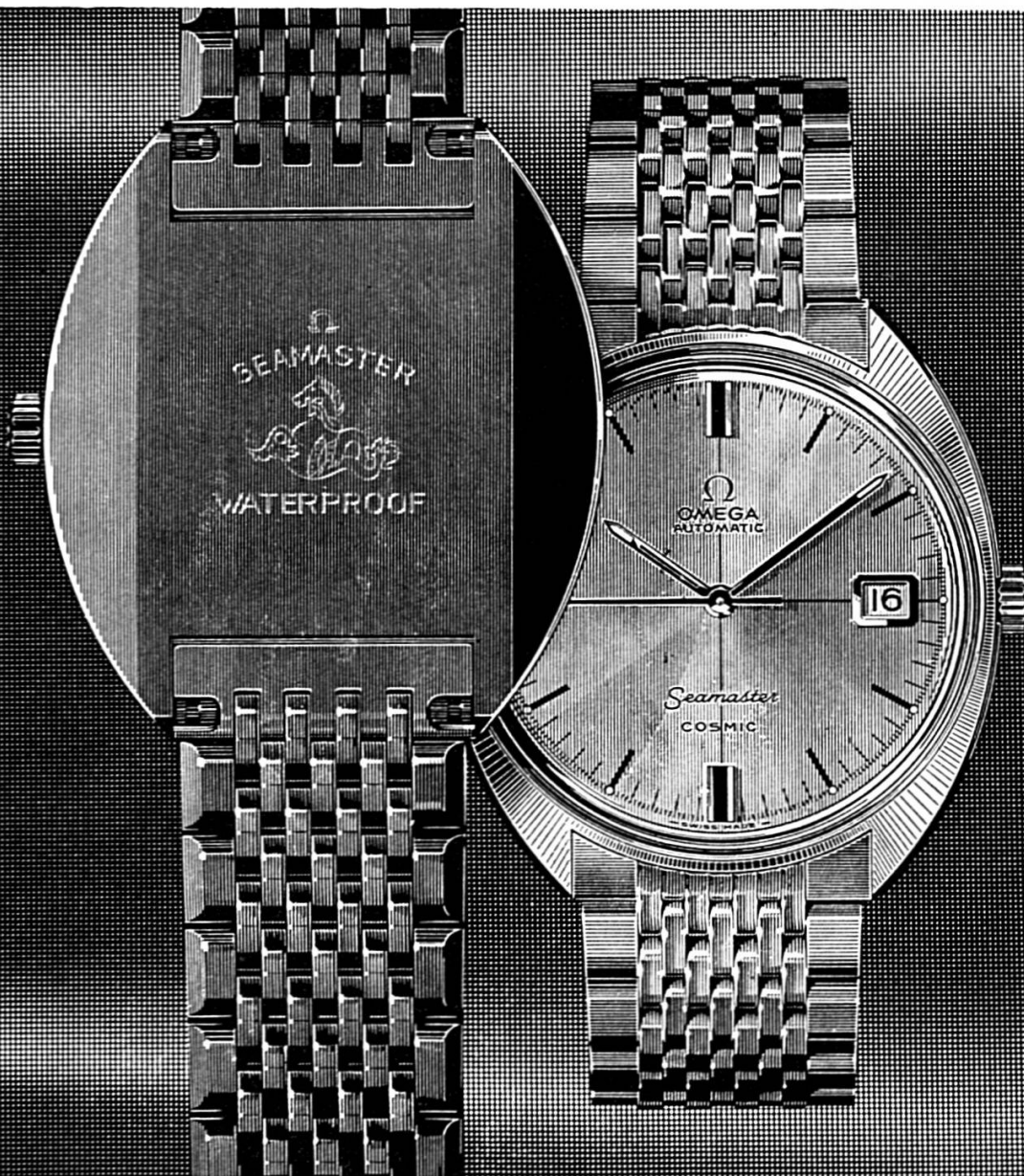
La Seamaster Cosmic: Etanche, calendrier, remontage automatique ou manuel