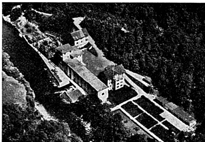
USINE DE LA GOULE SUR LE DOUBS