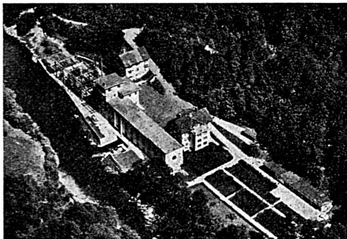
USINE DE LA GOULE SUR LE DOUBS