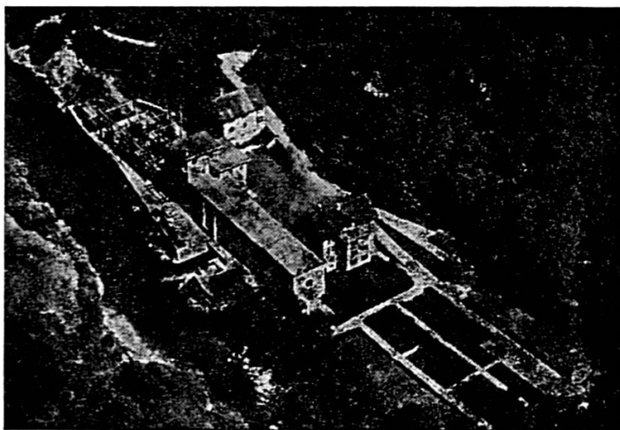
USINE DE LA GOULE SUR LE DOUBS