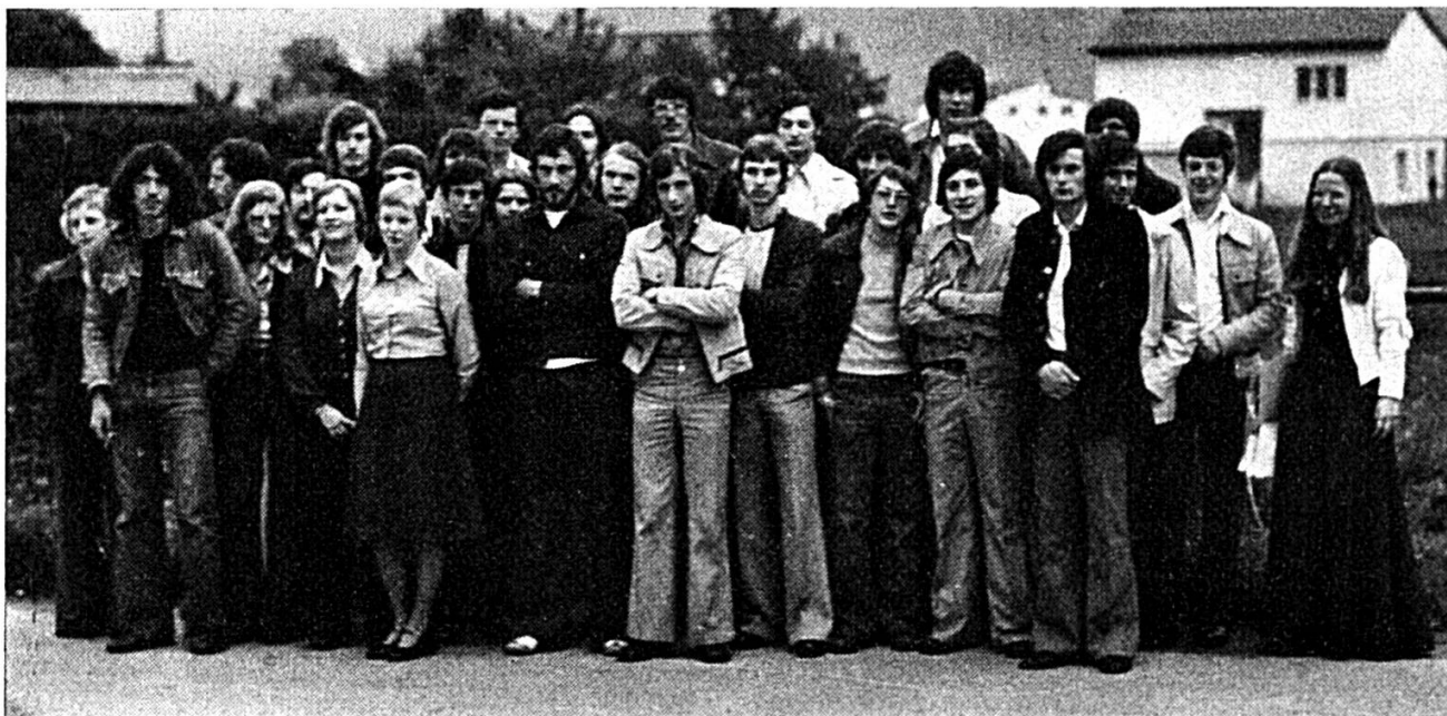
Cliché ADIJ No 717