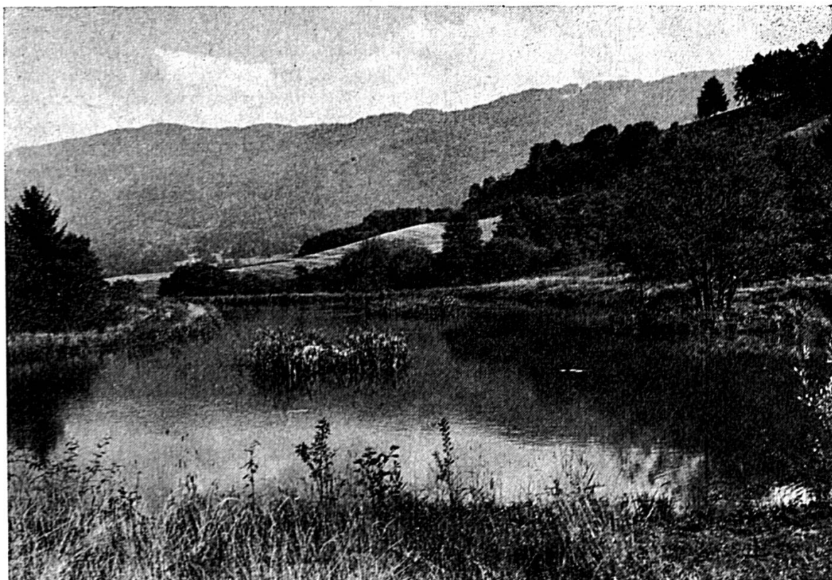
Etang des Chaux-Fours après les travaux ; à gauche la digue.