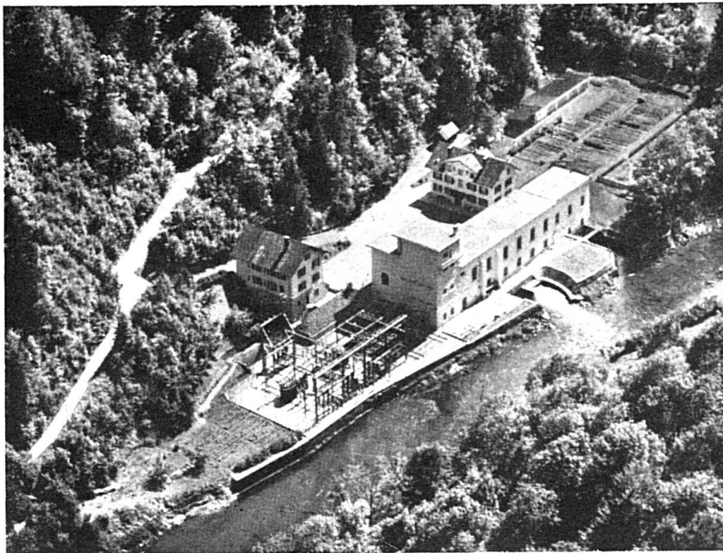
USINE DE LA GOULE SUR LE DOUBS