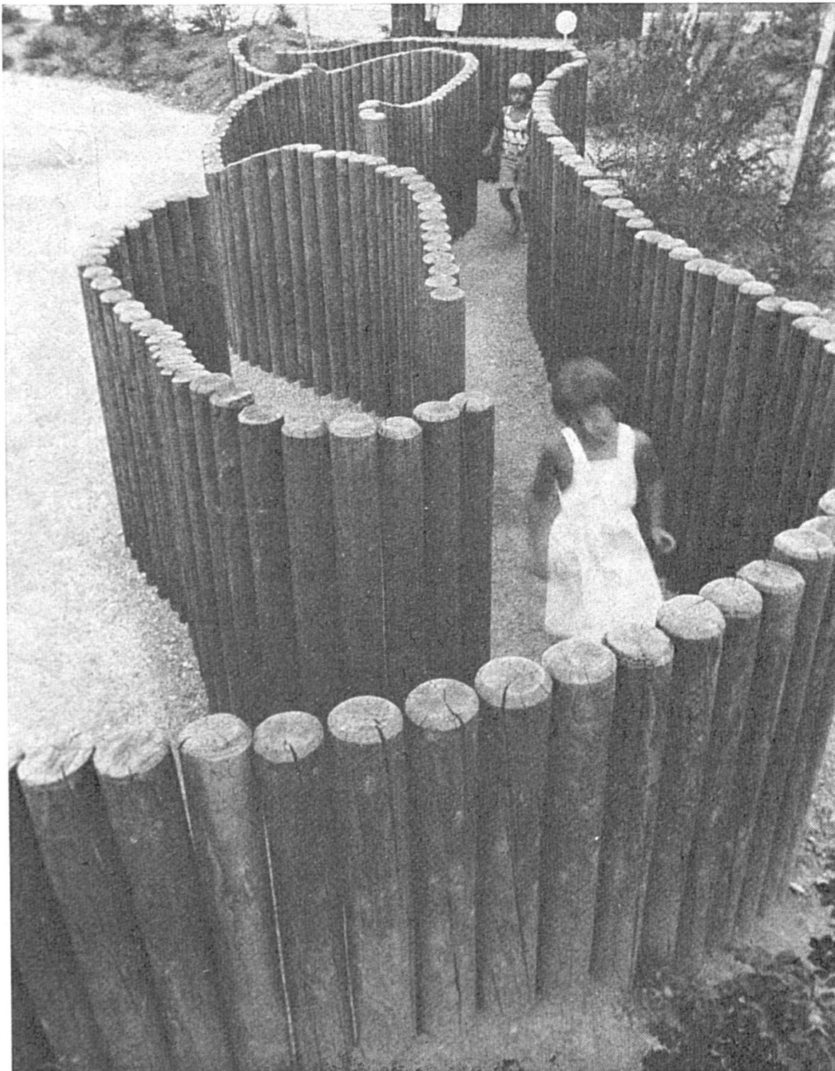
L'attrait d'une place de jeux dépend essentiellement d'une disposition variée et vivante. Le bois, matériau naturel, crée une ambiance sécurisante pour les enfants.

périmentations. Les installations en bois sont les meilleures du point de vue valeur pédagogique car elles correspon-