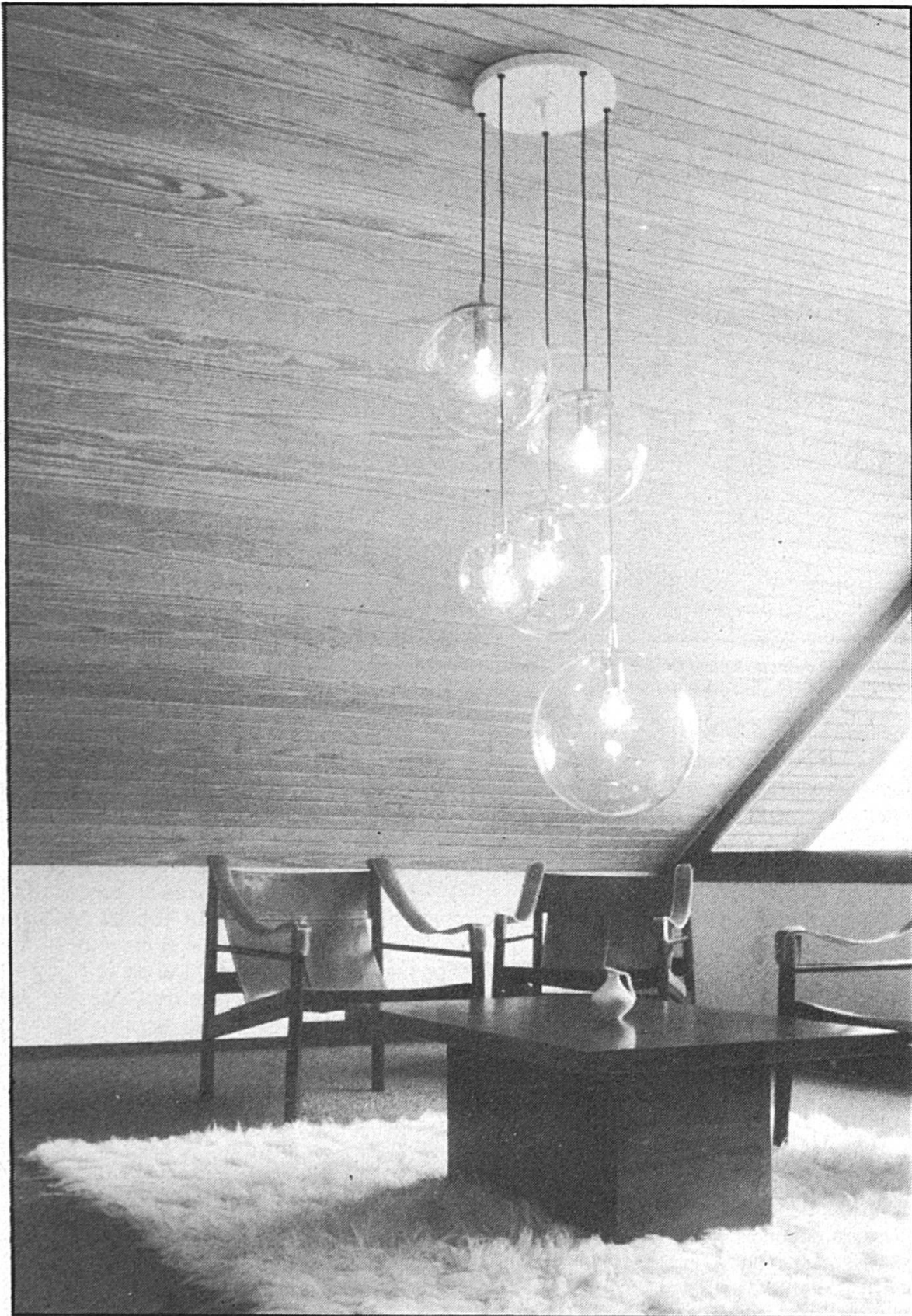
Les pièces un peu froides destinées au séjour de personnes peuvent être «réchauffées» par l'emploi du bois.