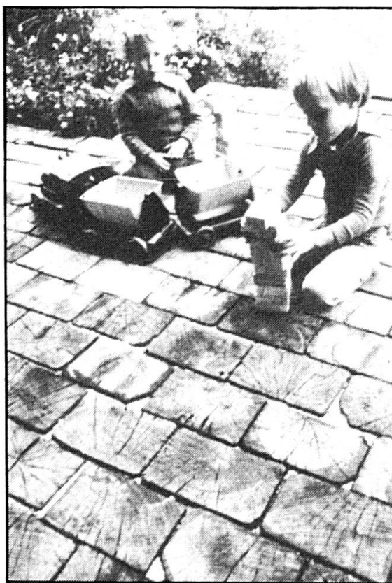
Pour rajouter une pièce de plein air à son appartement, il est judicieux de bien choisir la nature du revêtement de sol. Les pavés de bois offrent une solution originale, qu'ils soient ronds ou rectangulaires.

Les villas luxueuses, isolées dans la campagne et entourées d'immenses parcs appartiennent à l'architecture du passé. Le renchérissement des terrains, dû à la disparition progressive des surfaces constructibles, a considérablement diminué la dimension des propriétés. Malgré cela, il reste encore suffi-