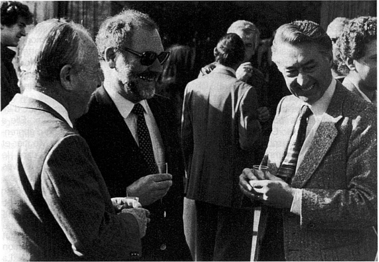
Reflets de l'assemblée générale 1984.