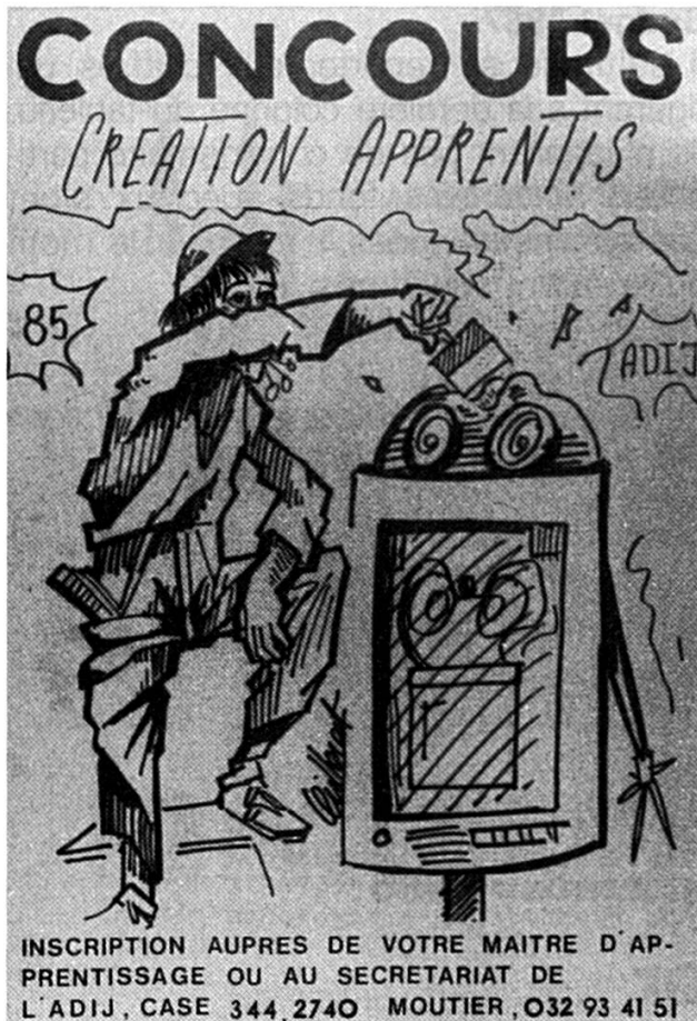
Une invitation à concourir.

un extraordinaire raccourcissement de la durée qui sépare la découverte technique de sa commercialisation. Ce phénomène n'est pas sans influence sur les métiers que nous exerçons.