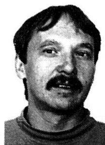
Par Gérard ROTTET