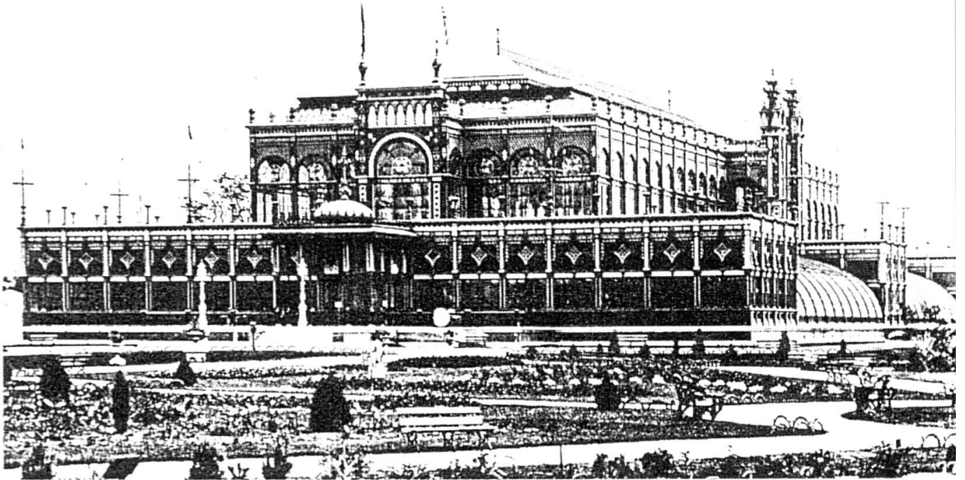
A Philadelphie, les produits étaient présentés dans des bâtiments thématiques. La halle de l'horticulture, représentée ci-dessus, était l'un des cinq bâtiments principaux de ce type. (Historical dictionary, 1990, p. 56).

plus grand embarras chaque fois qu'il s'agit de consulter les intérêts généraux de l'industrie jurassienne». Il proposa donc la création, dans les plus brefs délais, d'une «Société intercantonale» qui serait la représentante de l'industrie horlogère auprès des autorités et qui défendrait la branche vis-à-vis de la concurrence étrangère.