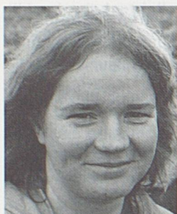
par Laurence Marti, présidente des Archives économiques et industrielles jurassiennes