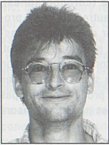
par Christophe Koller, licencié en histoire économique

150 ans de patrimoine horloger dans le Jura bernois et à Bienne