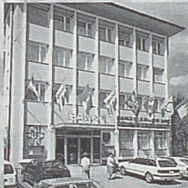
Delémont - Molière