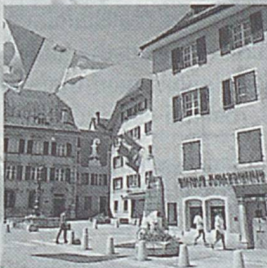
Delémont - Ville