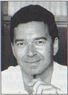
Par Jean-Paul Bovée, secrétaire général de l'ADIJ