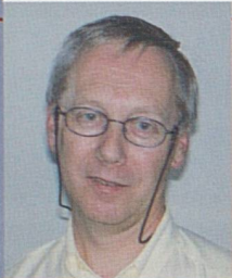
par Michel Antoine