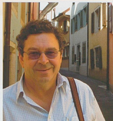
Par Jean-Paul Bovée

Economiste, professeur chargé d'enseignement à la Haute Ecole Arc Economie