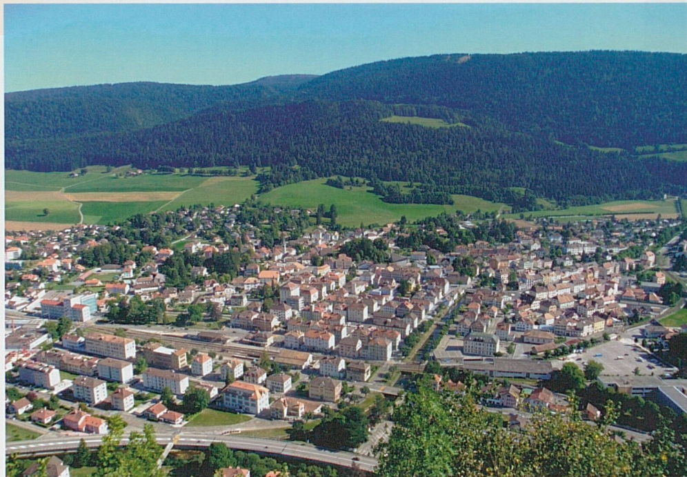
Fleurier, le plus grand village du Val-de-Travers

Le fonctionnement de la commune s'est considérablement simplifié dès lors que l'on a passé de neuf communes et huit syndicats intercommunaux à une seule commune. Au lieu de dix-sept comptabilités plus ou moins interdépendantes, on n'en a plus qu'une. La commune a donc gagné en transparence et sans doute en démocratie. On sait en effet par expérience que l'activité des syndicats intercommunaux fait l'objet de relativement peu de contrôles.