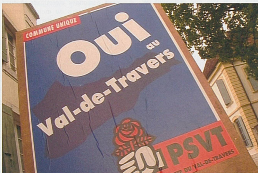
campagne en vue de la votation sur la fusion

Il avait été promis à la population que la nouvelle commune maintiendrait dans chaque village un guichet. Après une période d'une année, il a été décidé de concentrer l'administration sur deux seuls sites, Fleurier et Couvet, les deux villages principaux. Cette décision a été prise après qu'il a été constaté que les guichets locaux, qui n'étaient pas ouverts en permanence, n'étaient en fait pas utilisés. La population se rendait de toute façon dans les guichets principaux, profitant d'un déplacement et d'heures d'ouverture plus favorables. Parallèlement, pour tenir compte des besoins d'une partie de la population, il a été décidé que l'administration se rendrait, sur demande, à domicile. Le service de proximité est ainsi maintenu.