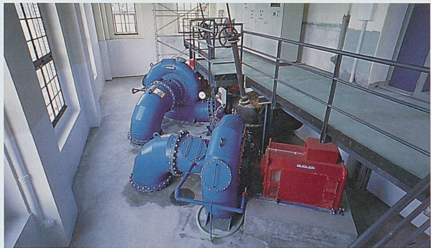
Intérieur centrale Dynamo sur la Birse au nord de Courrendlin, puissance 380 kW, production annuelle, de l'ordre de 1,5 millions de kWh

Hormis la centrale de la Goule, qui a une capacité de production industrielle, on ne recense dans le Jura que de petites centrales. En raison du caractère renouvelable de l'énergie qu'elles produisent, les petites centrales hydrauliques ont suscité un regain d'intérêt dès le début des années nonante. La plupart de ces petites centrales ont été modernisées, pour celles qui étaient toujours en fonction, ou réhabilitées, pour celles qui ne l'étaient plus. Mais si ces petites centrales ne parviennent toujours pas à offrir du courant à prix concurrentiel,