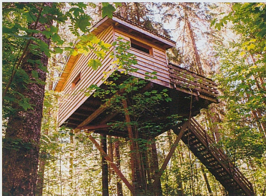
Une cabane en bois occupée les deux tiers de la saison.