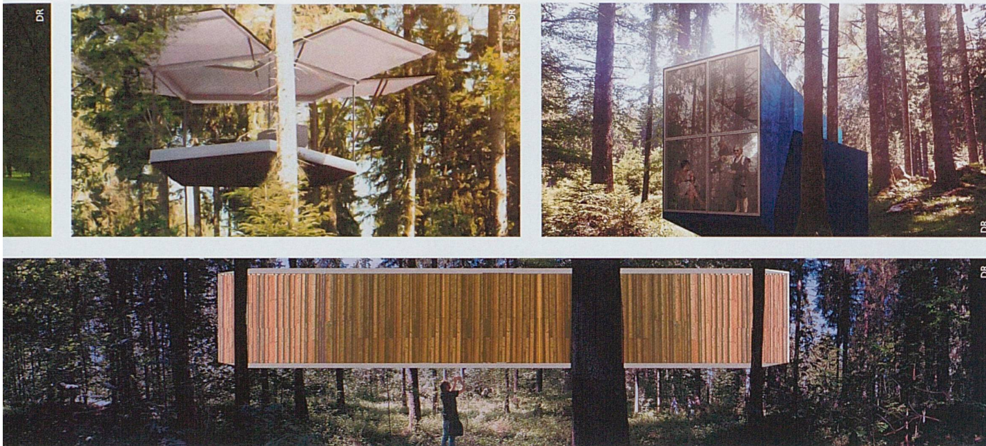
Quelques projets des différentes cabanes prévues à partir de 2017.