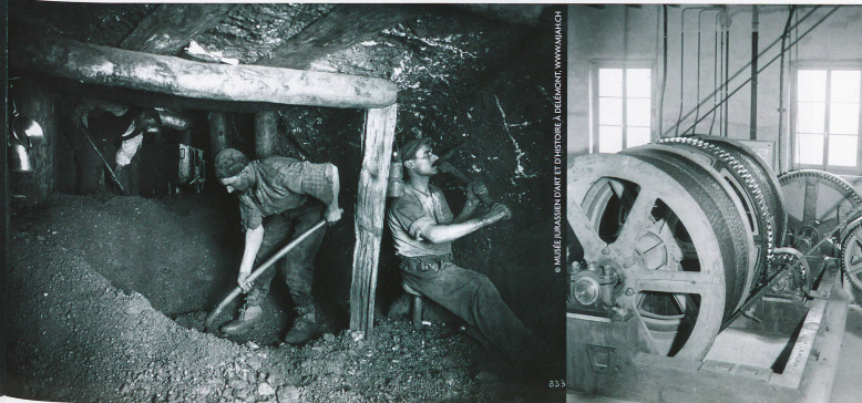
À gauche: équipe de mineurs abattant le minerai et le chargeant sur un wagonnet. À droite: machinerie de l'ascenseur dans une tête de puits.