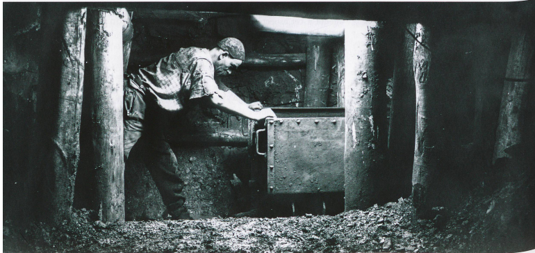
Wagonneur poussant le minerai jusqu'au bas de l'ascenseur.