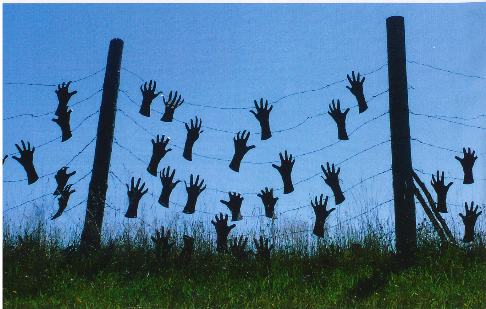
La Balade de Séprais, un parcours culturel original fort apprécié.