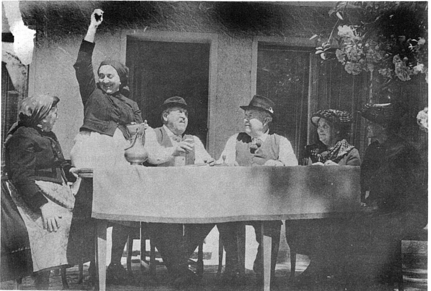
Une scène de la pièce valaisanne: Les Cabales des femmes