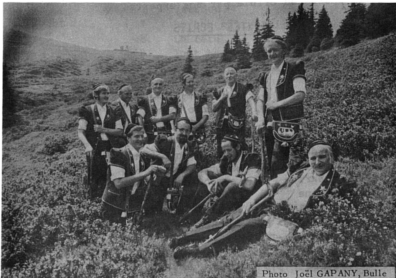
LES ARMAILLIS DE LA ROCHE Direction : M. André BRODARD