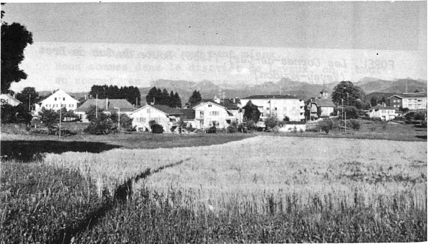
SAVIGNY. Dans le fond : les Préalpes fribourgeoises ; à gauche : Le Moléson et Trémèttaz.

Par la grande charrière Moudon-Vevey, descendons du côté du midi : nous voici au Pont de Pierre (on dit aussi : Le Pigeon, mais j'aime mieux Le Pont de Pierre - qui franchit le Grenet). Là, "ils" sont rudement bien montés : un collège, une boutique, un restaurant, une freteri, un battoir et même une banque !