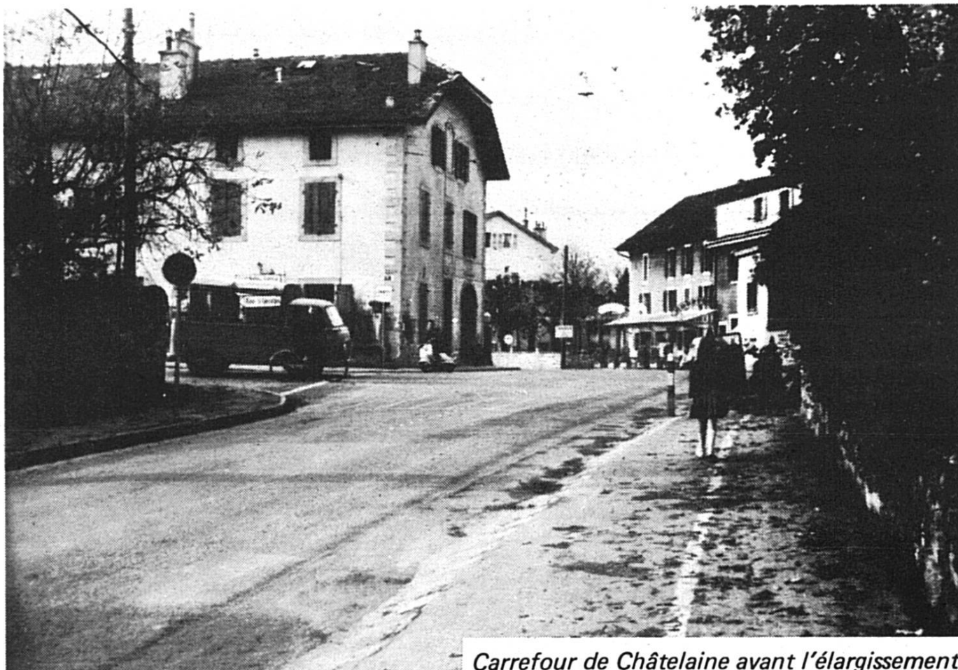
Carrefour de Châtelaine avant l'élargissement

que de Genève vendit les biens communaux de Châtelaine. C'est à ce moment-là qu'un plan d'ensemble des chemins à créer fut établi. La mauvaise récolte des blés de 1789, ainsi que la vague révolutionnaire qui fit suite à la prise de la Bastille, eurent pour conséquence une disette qui se fit cruellement sentir dans le pays. La France plaça deux escadrons le long de la frontière genevoise pour empêcher la sortie du blé du pays. Un détachement de 15 hommes se trouvait à Châtelaine, afin d'empêcher les Genevois de venir s'approvisionner en pain chez le boulanger Barbier à Châtelaine. La présence de ce détachement donna lieu à plusieurs incidents vu qu'il allait fréquemment faire des patrouilles dans la banlieue genevoise. Genève fut sollicitée pour accorder des prêts de blé, ce qu'elle accepta.