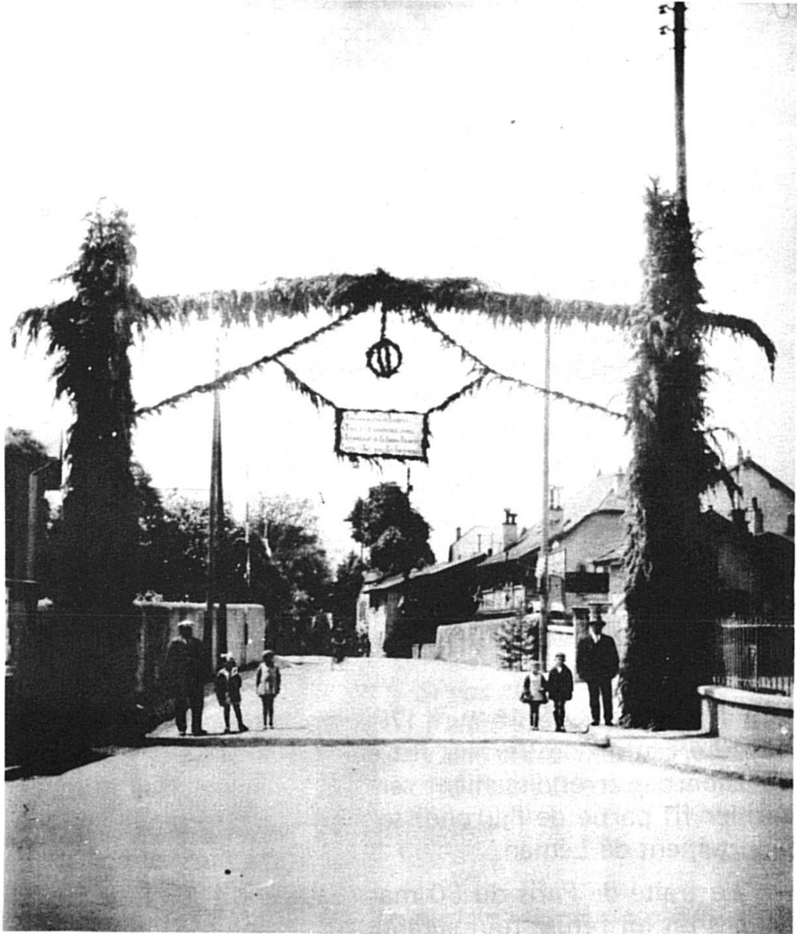
Avenue Henri Golay, après élargissement vue de son prolongement : Av. Edmond Vaucher

source de tiraillement entre Châtelaine et certains citoyens genevois qui ne le voyaient pas d'un bon oeil. D'autre part, les recettes étaient souvent insuffisantes. La salle fut louée à des troupes de passage jusqu'en 1798, année où elle fut définitivement fermée.