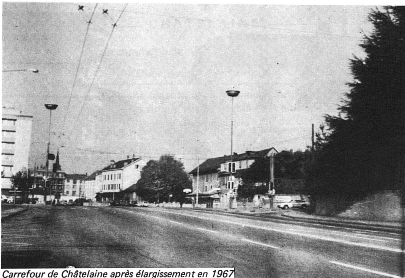
Carrefour de Châtelaine après élargissement en 1967

engrangées. Pour les mener à Genève, ils devaient passer sur territoire français. Ils se firent délivrer les déclarations d'usage qu'ils firent viser par le maire de Vernier. Les chargements passèrent sans encombre dans cette localité, mais furent interceptés à Châtelaine par les dragons du roi qui les séquestrèrent. Finalement, après moultes démarches, les Genevois furent autorisés à transiter leurs blés.