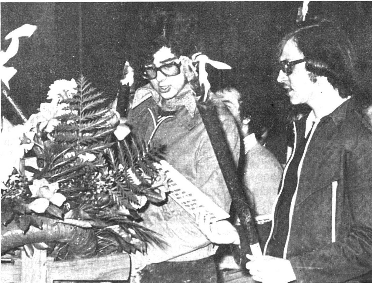
Le chant du Surrexit, durant la nuit de Pâques, sur le cimetière

Blottie durant de longs siècles autour de sa majestueuse collégiale, entourée d'un imposant système de défense composé de tours et de remparts, la petite cité des rives du lac de Neuchâtel s'est peu à peu éveillée à la vie moderne. L'industrie a largement devancé l'agriculture alors que le commerce et l'artisanat, menacés par la présence de grandes villes voisines, ont fourni un bel effort afin de conserver au chef-lieu broyard une situation aujourd'hui enviable. Il est vrai que la position géographique de la localité, sise au bord du lac, lui enlève passablement l'importance dont jouissent par exemple Romont ou Bulle.