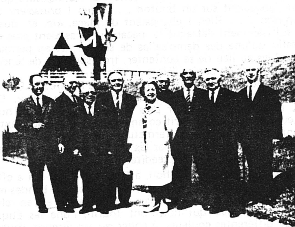
Le Conseil des patoisants romands, en été 1964, Exposition nationale suisse, à Vidy-Lausanne.

A propos de photo, voici celle du Conseil des Patoisants romands, à l'issue de sa séance tenue à l'EXPO, le dimanche 31 mai. (Journée des Savoyards).