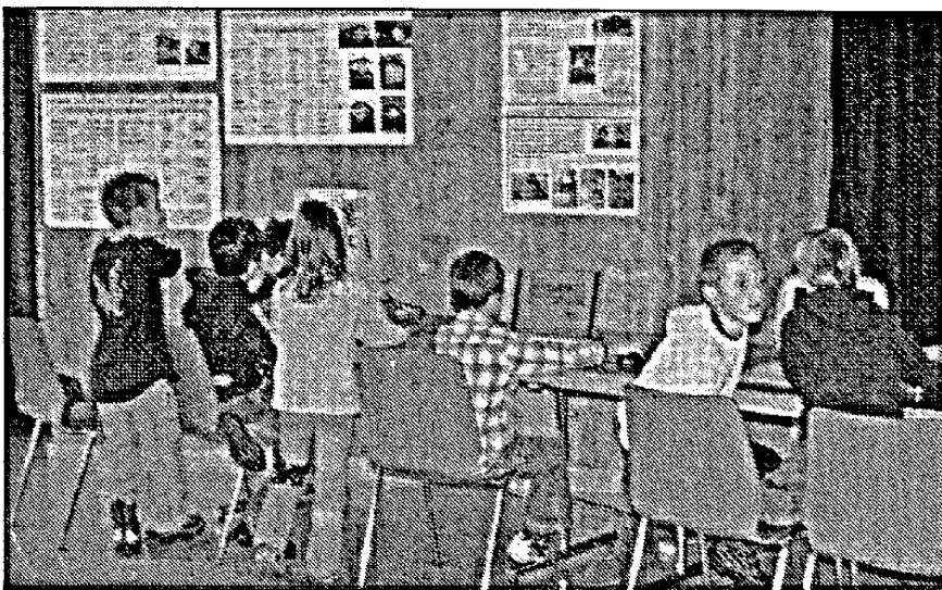
Atelier-découverte avec l'ordinateur qui parle patois, 2007.

à rassembler le trésor des patois. De l'autre, à l'école des patois, l'institution scolaire et la formation continue prennent le relais dans le devoir de transmission des savoirs.