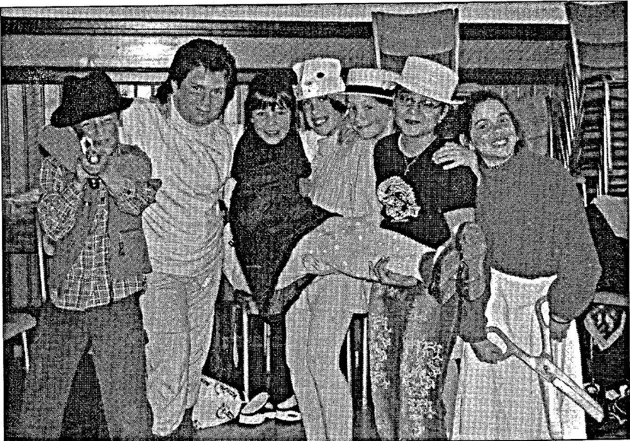
Théâtre 2003. P'têtes musattes (proverbes mis en scène).

Voici quelques thèmes de spectacles traités ces dernières années: