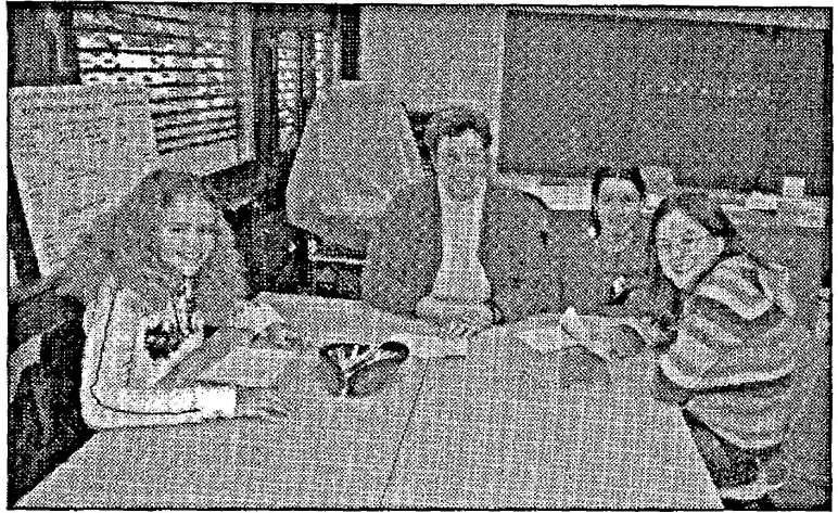
Atelier de Noël, 2005.

- Deux séries de cours pour comprendre le système phonétique et apprendre à lire le patois ont été organisés dans le cadre de l'Unipop de Savièse en 2001 et 2002, ainsi que lors de deux cours publics.