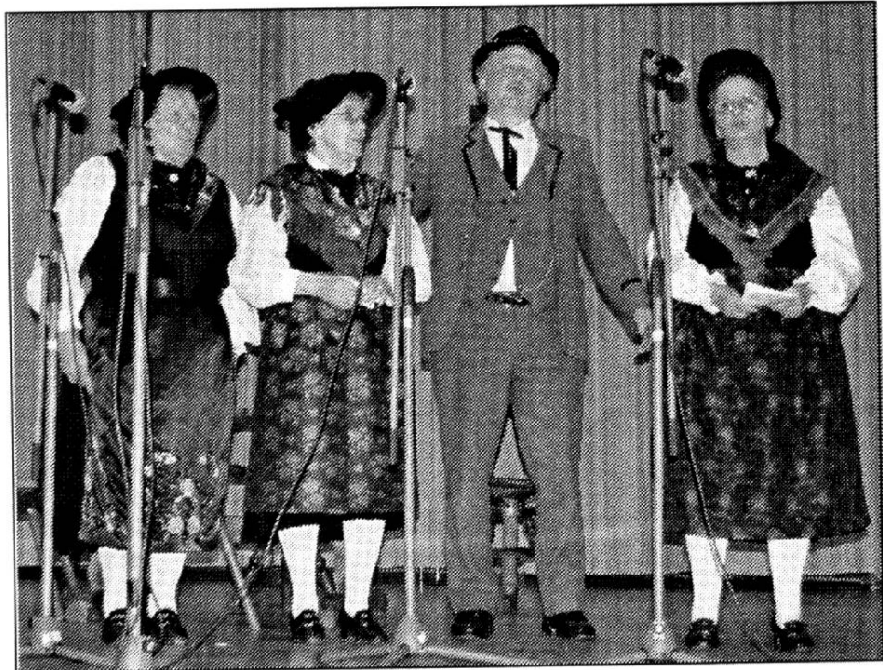
Sur la scène de la Veillée cantonale d'Evolène. 28 octobre 2006.

La prochaine Fête Cantonale des Amis du Patois aura lieu les 31 août, 1er et 2 septembre prochain à Nendaz. Comme ce fut souvent le cas par le passé, les défenseurs du patois et du folklore étant cousins par l'histoire et par le cœur, la manifestation sera liée à un autre événement. En effet, le groupe folklorique La Chanson de la Montagne de Nendaz a le plaisir d'accueillir les patoisants dans le cadre de son 50e anniversaire.