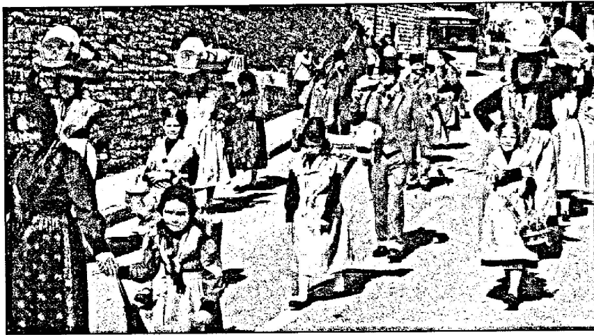
Les Bedjuis d'Isérables (VS).