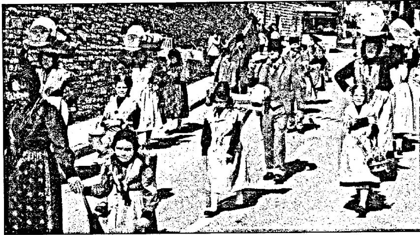
Les Bedjuis d'Isérables (VS).