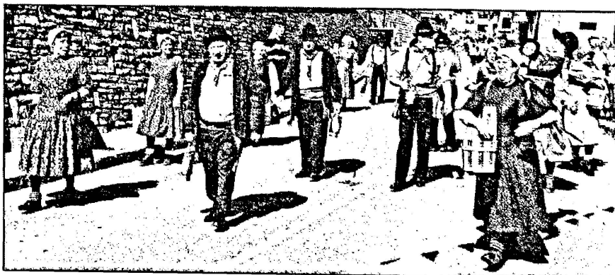
Société Costumes et Patois, Savièse (VS).

Les étoiles brillent depuis longtemps quand les derniers quittent le site de la fête, la satisfaction des organisateurs, les rencontres chaleureuses, les airs de la fête, la joie communicative et chaque instant de la journée viennent enrichir la mémoire de la Chanson de la Montagne et celle des patoisants.