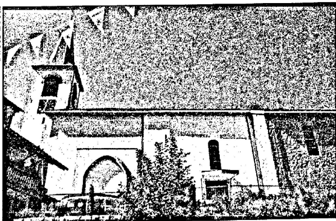
Eglise de Basse-Nendaz.