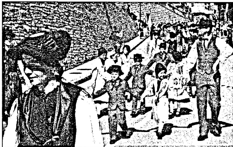
La Chanson de la Montagne.