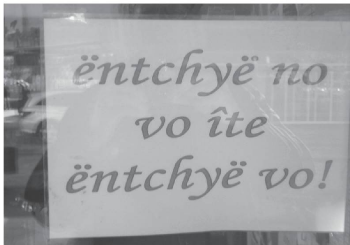
Sur la porte d'entrée du Buffet de la Gare à Sierre, le 11 novembre 2013.

Bravô ! bravo ! Fèleussetâ , féliciter; fèleussetassiôn , fèleussetachiôn , félicitation.