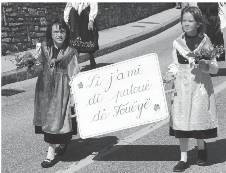
Fête cantonale du Patois, Nendaz (VS), 2 septembre 2007.

No chin brâmin jénô (évèrgouogna) pouo to chin kë vouo j'ai dju fire (j'ai fi). In tchui-ka, chë vouo jaï mank'a d'on kou dè man pouo li vègne, li fin, û..., no charây'in kontin dè pouëvaï vèni vouo j'édjië achebeïn... Nous sommes vraiment gênés pour tout ce que vous avez dû faire. En tous les