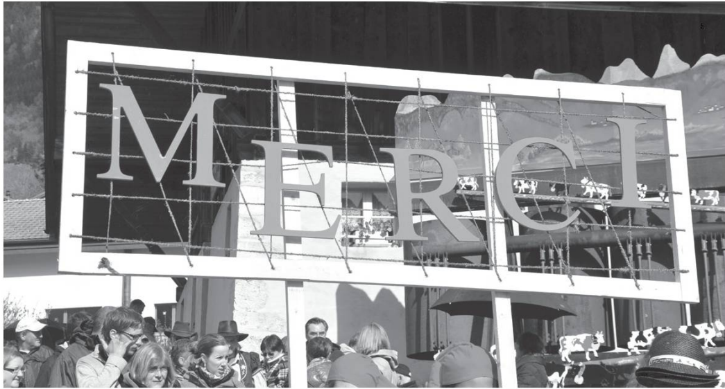
Poya d'Estavannens, 12 mai 2013.