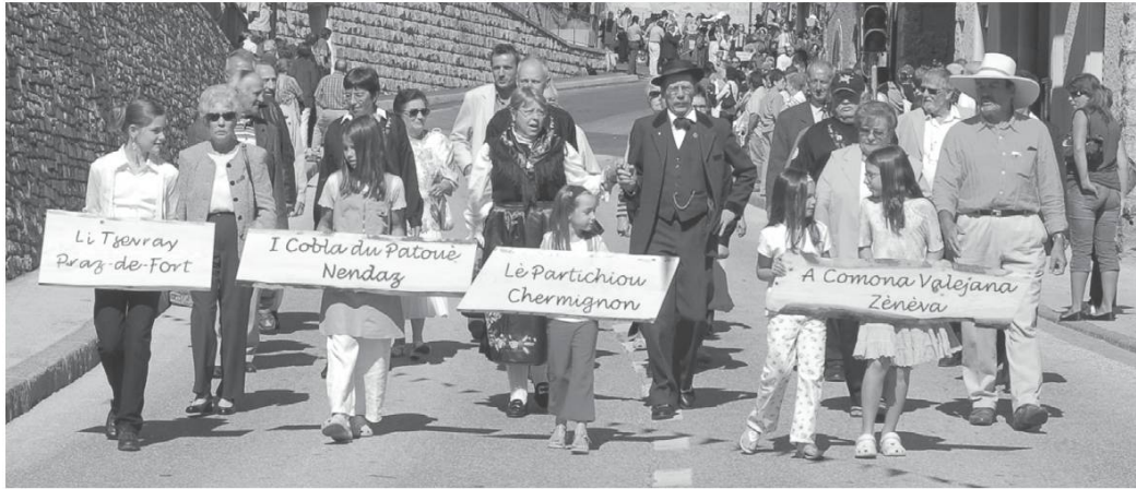
Fête cantonale du Patois, Nendaz (VS), 2 septembre 2007.

de l'avalanche, etc. Jyou mèrsi , Dieu merci, je suis arrivée à temps, etc. Chavéi dè grâ , savoir gré, être reconnaissant. Cette locution verbale s'utilise essentiellement à la forme négative, èn cha pâ dè grâ , je ne sais qu'en faire; charéi pâ dè grâ dè ché peùlyo , je ne saurais que faire de cette maison. Par contre, la qualification par l'adjectif bon confère à la locution une valeur positive : Chavéi bon grâ , savoir gré, litt. bon gré. Lù pàrre-grô l'a byèin éjyà kann îre mèinnóou è ly ènn a chopouè bon grâ tan k'a la fin , son grand-père l'a bien aidé quand il était enfant, il en a été très reconnaissant jusqu'à la mort. Rèkonyèchènn (fém. rèkonyèchènta ), reconnaissant. Y'a byèin rèchyoùk, è y'a ightà rèkonyèchènn , il a beaucoup reçu et il en a été reconnaissant. Rèkonyèthre , être reconnaissant. Fô rèkonyèthre chóou-j-amik , il convient de se montrer reconnaissant à l'égard de ceux qui nous soutiennent. En réponse à un service rendu, quelques locutions de gratitude se réfèrent à l'autorité divine, on s'en remet à Dieu pour qu'il attribue la juste récompense à celui qui a effectué un acte de générosité à notre égard : Lù Bon Jyou lo tè rende ! que Dieu te le rende ! Lù Bon Jyou tè pâye por mè ! que Dieu te le rende, litt. te paie pour moi ! Les bonnes actions sont placées dans l'orbite du ciel.