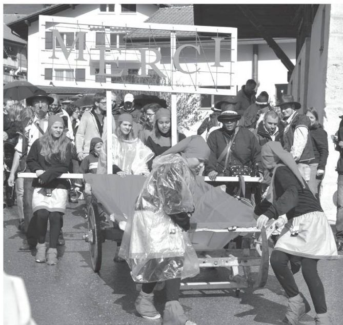
Poya d'Estavannens (FR), 12 mai 2013.

Dans la même optique patoisante, le verbe 'remercier' affleure rarement dans son emploi absolu, sa portée signifiante se colore avec des adverbes ou des mots employés comme adverbes, véhiculant une valeur positive : próouk, byèin, tan, grô . En vain cherchera-t-on en patois les équivalents immédiats de 'chaleureusement', 'infiniment', 'cordialement', 'vivement', etc. pour préciser