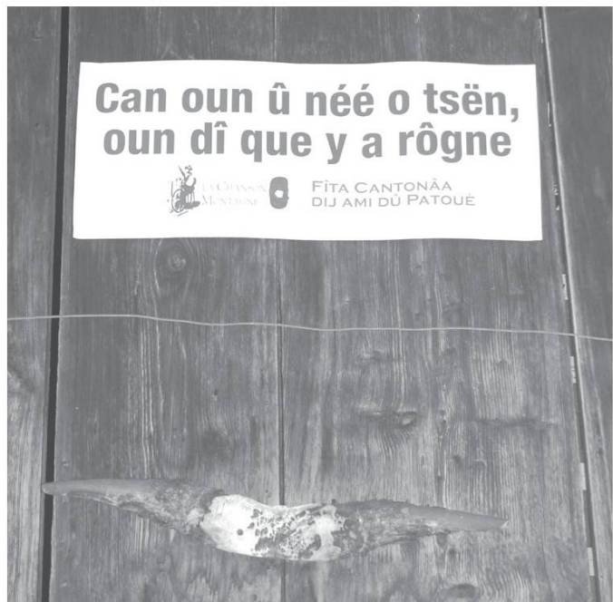
Fête cantonale du Patois, Nendaz (VS), 2 septembre 2007.

Tô ô plizi l'ê por mè , tout le plaisir est pour moi.