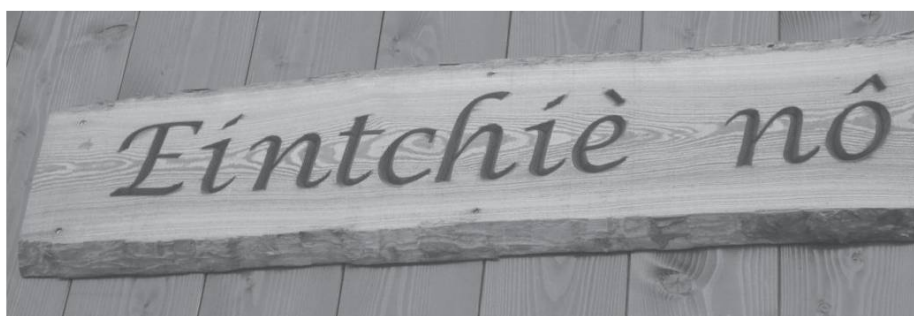
Chez nous. Bâtiment à Ollon, Chermignon, le 5 novembre 2013.

Rècompénchâ, chantefére , récompenser. Mèrèto , mérite. Hla vèva ya prou dè mèrèto d'alèvâ lè j'einfàn cholèta , cette veuve a bien du mérite d'élever ses enfants toute seule. Mèrètèin , (fém. mèrètèinta ), méritant.