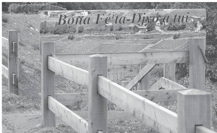
Fête-Dieu à Chandolin (Savièse), 3 juin 2010.

T'a cranamin fé ché traó, bravó ! T'a byin amereta ona réconpincha. Tu as courageusement fait ce travail, bravo ! Tu as bien mérité une récompense.