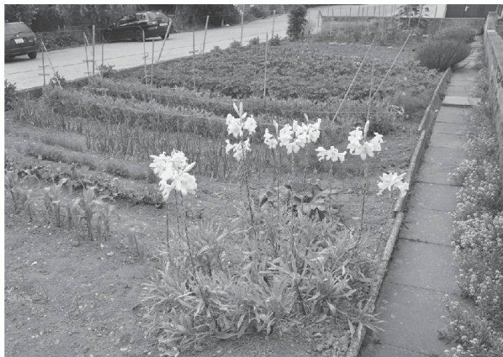
Jardin de Savièse. Photo Bretz, 2014.

Chi dzoua, no j'an goutâ avu chin ke no j'avan prê avu no. L'archenal èthi dèbordâ.No j'an totchi in pou dè tin : le novi fuji ke l'a rinpyèthi chi a tabatyère, di badyè dè tèrayâ, chèr-pètè, pâletè, de la munihyon, tsakon than vin kartouchè è di provijyon dè tsé, chukro, choupa, in konchèrvè bin intindu. Nothré cha a pan, gamalè èthan tsouhyi è pèjan. On pou dre ke no j'èthan tsêrdji kemin di j'âno. No chin modâ po Mora, yô no j'alâvan pachâ la premire né. Pu no j'an konti-nuâ tantyè i frontèrè.