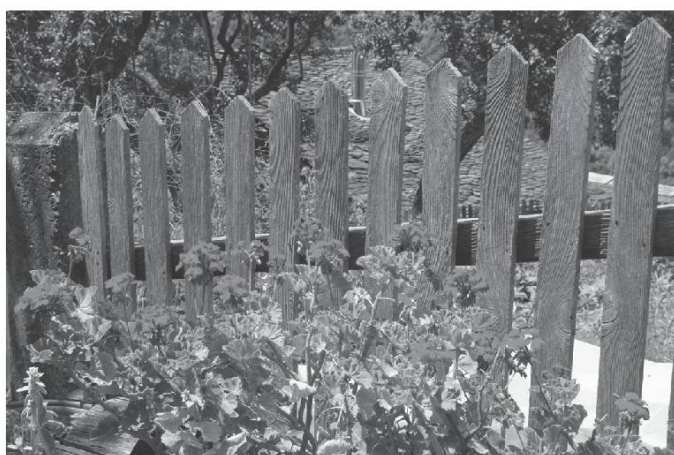
La paléd è géranium dè din lò tin.

Les choux, lu tsou . Les choux-fleurs, lu tsou fleur . Le pied du chou, la pata du tsou . Le chou a pommé, lò tsou a pòmò .