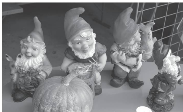
Amis des jardins.

Pour la récolte des gros légumes, il fallait des paniers solides, en racines de sapin pelées et coupées en deux dans le sens de la longueur, lè ranpòè .