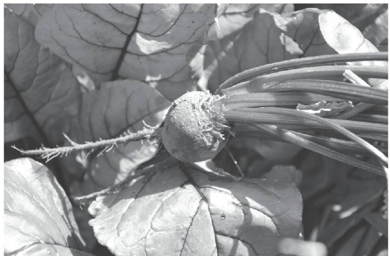
Racine rouge.

Parmi les légumes traditionnellement cultivés figurent surtout : lè fâve , fèves (sing. fâva ); lè rébùne , les carottes (sing. rébùna ); lè tsoûss , les choux (sing. tsoû ), lè tsoû-râve , les choux-raves, lè karôte rôze , les racines rouges ainsi que lè pòrèss , les poireaux (sing. porètt ) et lè-j-ùnyònch , les oignons (sing. ùnyòn ). A l'automne, ces légumes étaient retirés dans la cave au sol en terre battue qui