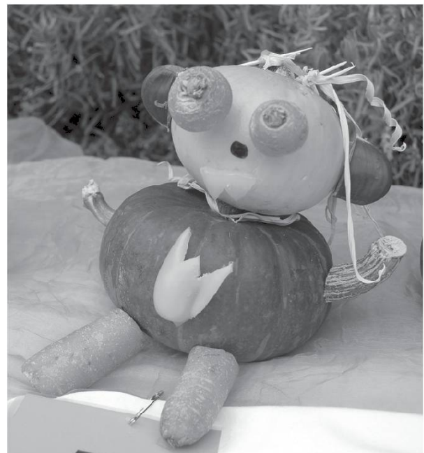
Fête de la Courge. 2010.