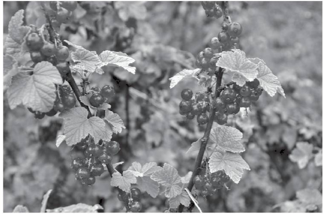
Groseilles, rejèn dé chèn Djyan .