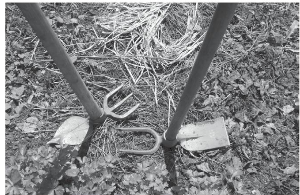
Fòsseur é pikète.