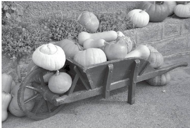
Fête de la Courge. Photo Bretz, 2013.

Au coin des jardins, il y avait souvent dé j-aouan dzanó , de l'osier jaune, dont les branches servaient d'attaches, de liens, é ryóouté .