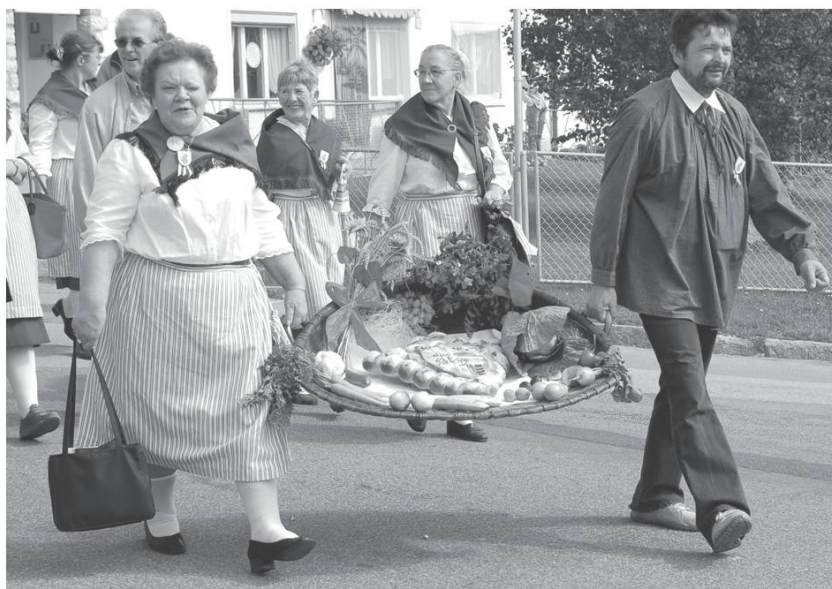
Les Genevez, fête des patoisants jurassiens. 3 septembre 2007.

Pouïche lù kourtù dóou patouê kontenuà dè rîgre a la rayà dóou solè óou dèjò na plozèta. Foudrè pro kapyonà, kapyonà è èïnkò kapyonà !