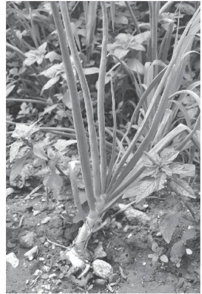
Oignon. Photo Bretz, 2014.

Crója é pómé dé têra , creuser [récolter] les pommes de terre.