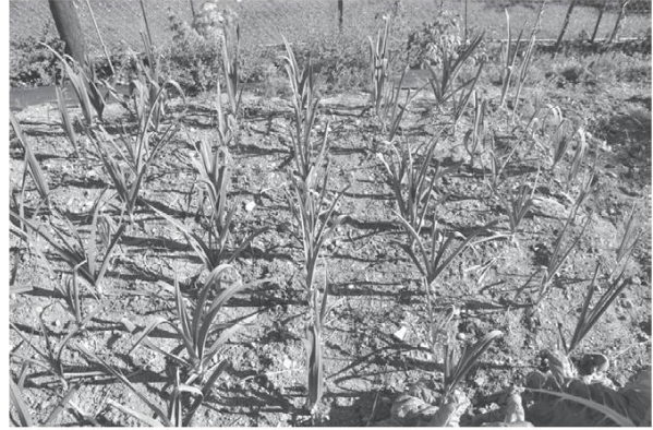
Colrave et poireaux.