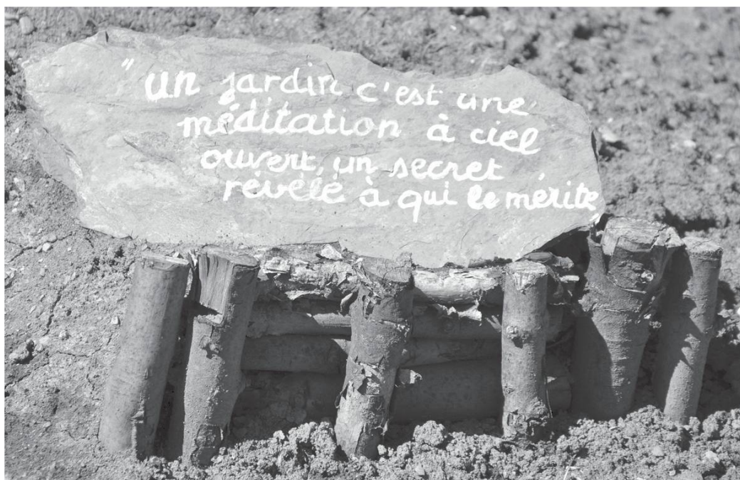
Savièse, été 2014.

Chaque région patoisante a élaboré un savoir-faire afin d'exploiter au mieux les jardins et la langue offre le vocabulaire nécessaire pour désigner précisément