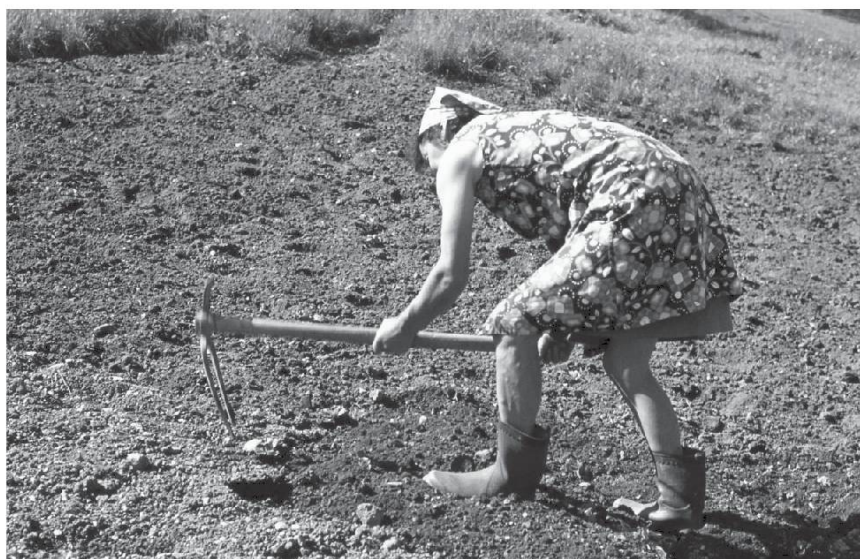
«Sarpiquage» des pommes de terre.

Quand je restais en haut à Ovrornaz, j'ai fait le jardin derrière le mayen. Je suis allée chercher du fumier à la fumassière (tas de fumier) à Buchard, pour le mettre au jardin. J'ai fossoyé pour faire pousser de beaux légumes ,