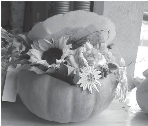
Fête de la Courge. Photo Bretz, 2010.

lades, les choux, les haricots nains , les carottes , les radis et les pommes de terre . Les mauvaises herbes ont, aussi, tôt fait de pousser. Il faudra continuer de désherber , de biner ou de sarcler et puis de combler les pommes de terre. De ce que tu as planté et soigné, tu en auras durant toute l'année pour faire de bons repas.