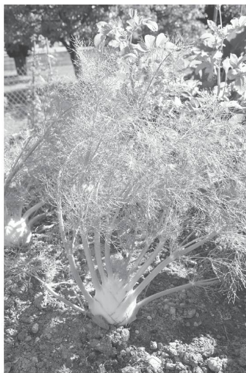
Fenouil, fanoué .

La chèmin , la semence. Li gran.ne , les graines. Li plantons , les plantons.