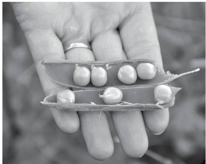
Petits pois. été 2014.

Cocombre , cornichon. Breinletta , ciboulette. Dâocetta, rampon, trotsetta , mâche. Ravonet , radis. Lè râvè , les raves; la ravâire , le champ de raves.