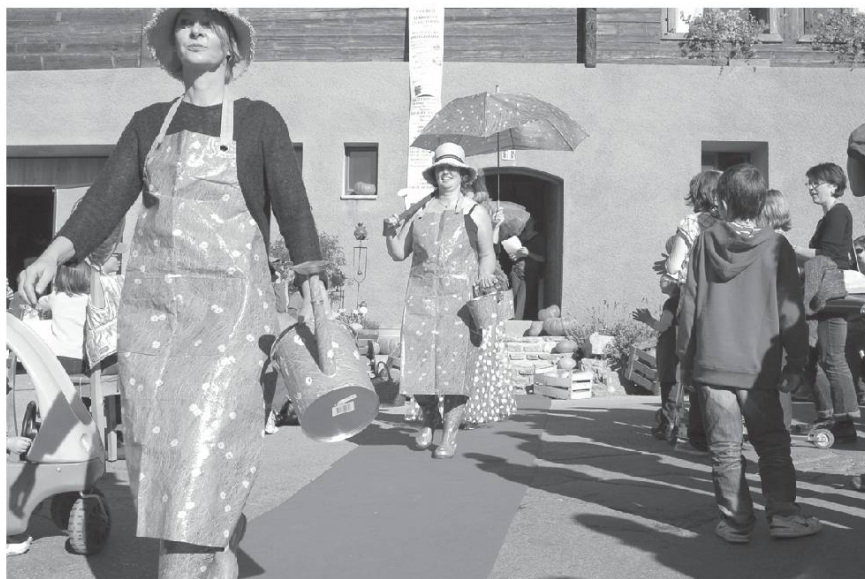
Défilé en mode jardinage. Fête de la courage, Chandolin. Photo Bretz, 2009.

Joli patois et beau jardin Il faut choyer ces deux plaisirs Fleurs de notre beau pays Qu'il faut toujours cultiver