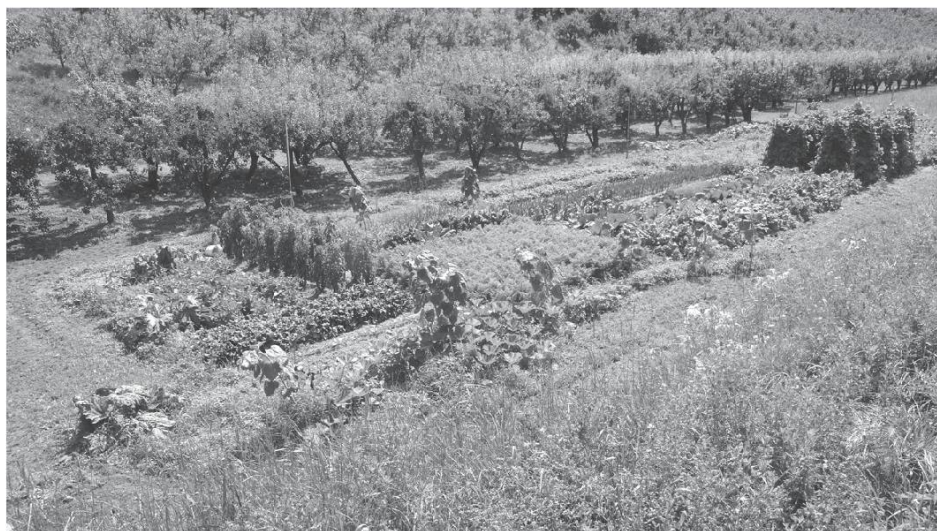
Jardin de Bieudron (VS). Photo Bretz, 2014.

L'achpèrje / li j'achpèrj'è (dè j'..) , l'asperge de culture intensive (les) / (des...).