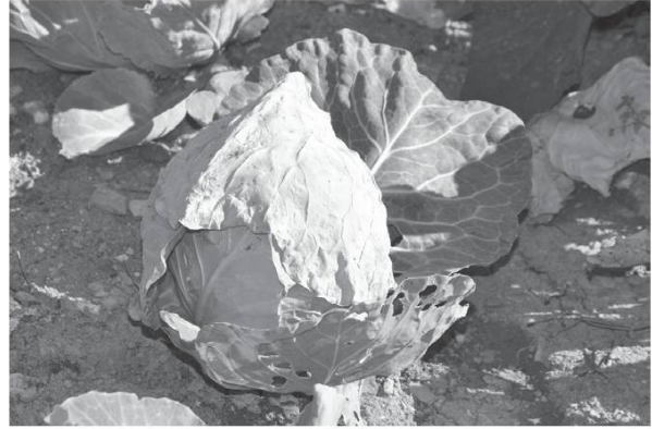
Tsóou-floo é tsóou blan qui est recouvert d'une feuille «pare-soleil».

dè saladè , planter des salades. Rpekò de por , repiquer de poireaux. Na shevelye , une cheville (plantoir). Èklarsi , éclaircir. Arashiyè lè môvèzèz èrbè , arracher les mauvaises herbes. Saklò avwé la pshèttà ou le begòr , sarcler avec la pioche de jardin ou le « bigard » (houe dont le fer a un côté tranchant et un côté avec 2 ou 3 dents). Butò, rparò lè tarteuflè , butter les pommes de terre. Ramò le pa , ramer les haricots. Na ròma , une rame. Plantò de peké pè lè tomatè , planter des piquets pour les tomates. Ramassò lè grazoulè , cueillir les groseilles. Areuzò , arroser. N areuju , un arrosoir.