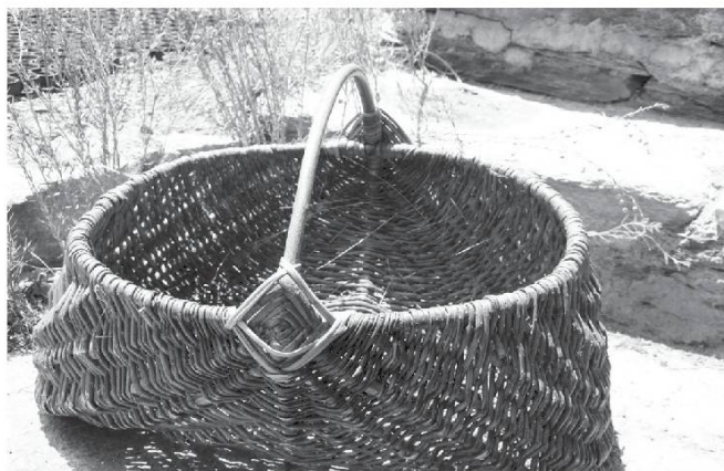
Kavan a tsinva én'avan.

Les raves, lè ròvè . La rave était considérée comme un légume de peu de valeur. L'interjection courante Ròva ! signifie Zut ! ou M... !