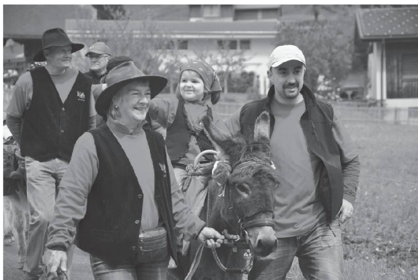
Le Bourriquet Club. Photo Bretz, Poya 2013.

Ce qui devait arriver est arrivé. Le jour de la mise, Pauline, le cœur gros, n'a pas pu aligner les billets de