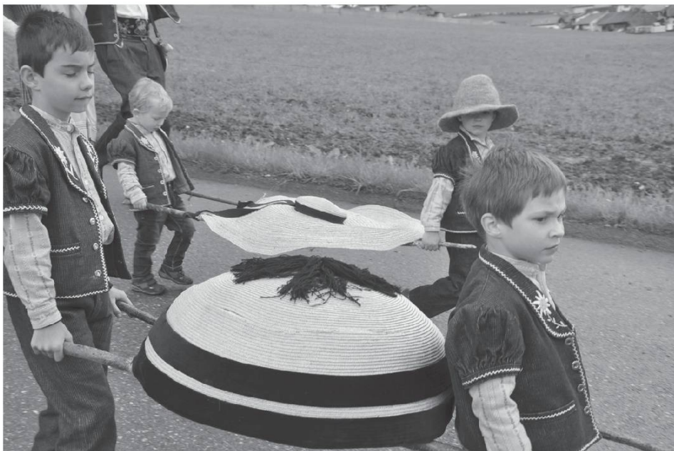
Groupe de danse folklorique Les Coraules, Bulle. Photo Bretz, Poya 2013.

Quand ils ont eu tout déchargé, c'était nuit. La veillée a été longue et la nuit courte. Le lendemain, après le déjeuner, les charretiers ont pris le chemin du retour. Ils se sont arrêtés quelques fois... ils disaient que les chevaux étaient fatigués ! Quand ils sont arrivés au village ils étaient contents de leur voyage !