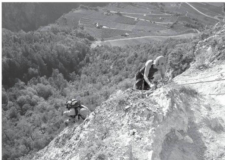
Via ferrata de Nax (VS).

L'équivalent dialectal courant de ‘monter’ est la locution verbale alâ choùk , se diriger vers un point situé à une altitude plus élevée ou à un niveau plus haut que celui de la route ou que celui où le locuteur se trouve ou se représente, litt. aller en haut.