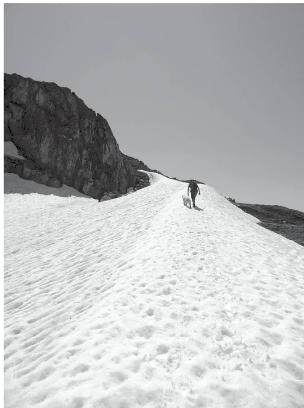
Pas de Lovegno, St-Martin, Val d'Hérens (VS).

Montâ , monter. Montâie , montée, rampe.