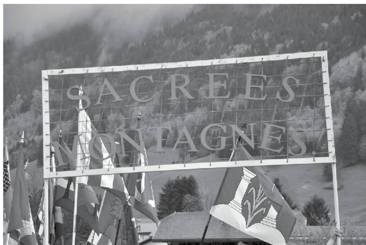
Sacrées montagnes, thème de la Poya d'Estavannens.

Monter à la poulie pour..., quetallâ . Poulie, ascenseur, réa (roue d'une poulie), quetalla (n.f.)