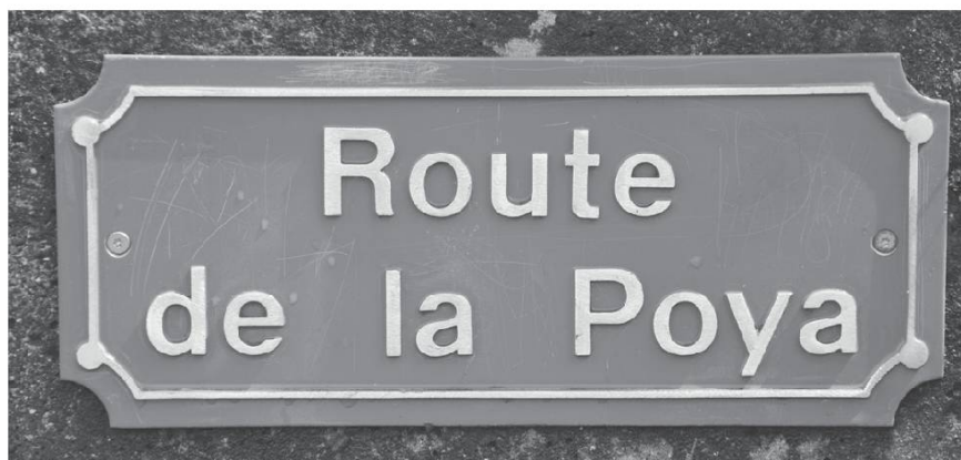
Estavannens (FR). Photo Bretz, 2013.

Le lexique dialectal recueilli autour du thème de la montée se caractérise par sa richesse et son expressivité. Certes, des verbes synthétiques émaillent le discours pour signifier le fait de monter : montâ, poyî, grapelyî, gradalâ (Jorat); montâ (Gruyère) où une formation diminutive adoucit la rigueur de la montée, montolâ , monter en pente douce.