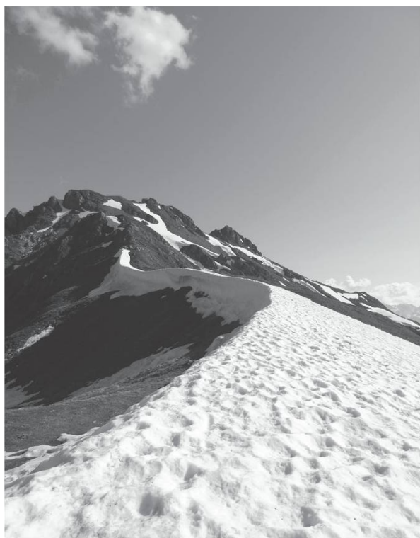
Col du Cou, Mase, Val d'Hérens (VS).

La korde , la corde. Achurâ , assurer. Le mouëchkëton , le mousqueton