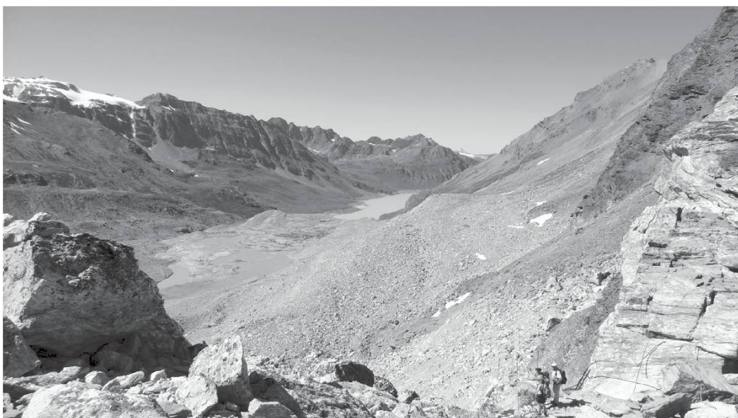
Pas de Chèvre, entre le Val des Dix et le Val d'Hérens (VS).

Alâ choùk damoùn , monter à l'étage supérieur. Alâ à l'amoùn , marcher en montant, litt. aller à l'amont.