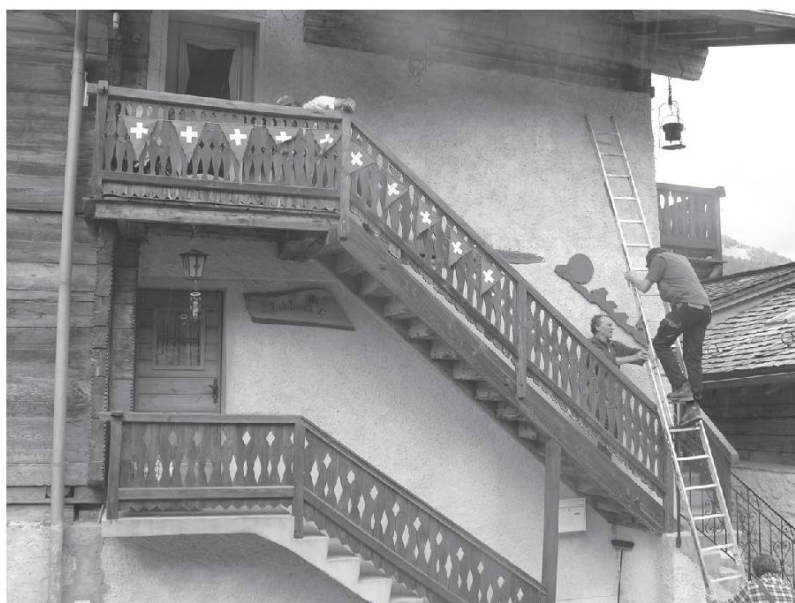
Echelle et escaliers à Mission (VS).

Pachâ chôp , monter (litt. « passer en haut »). Ôn zor, pâcha chôp a Tsèrmegnôn