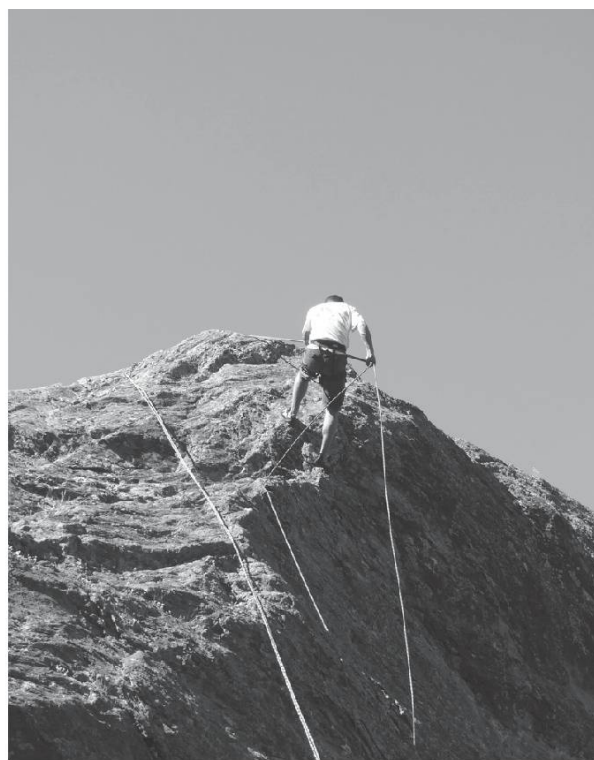
St-Barthélemy, Arolla (VS).