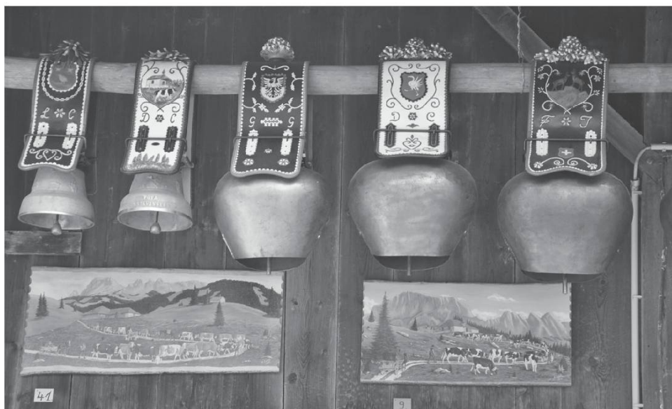
Estavannens (FR). Photo Bretz, 2013.

Kin n'in voulu alâ u sondzon du kouol dé La Forkle, no no sin pâ rindu konte kè l'ére draï min la borne pouo arevâ inô li.