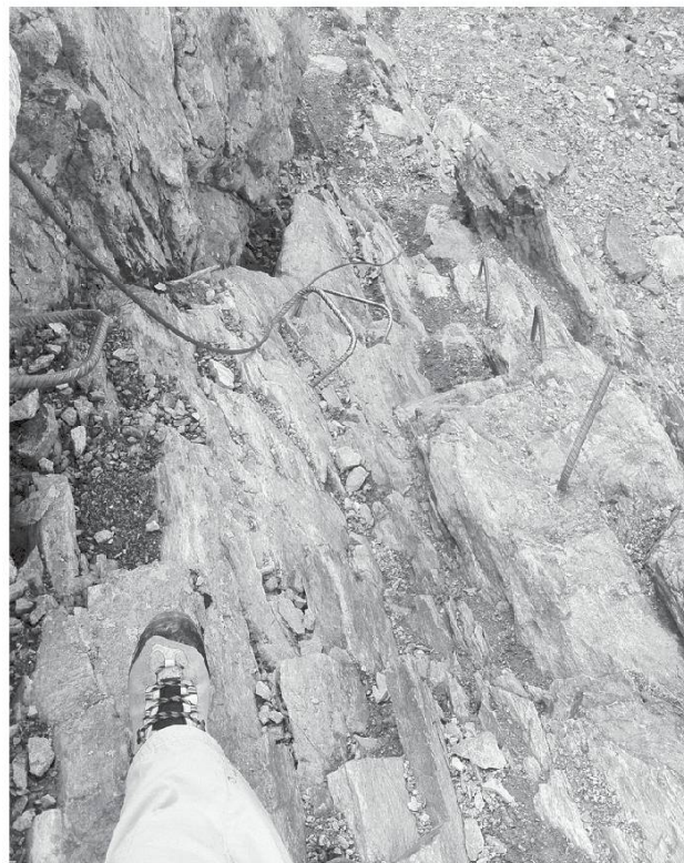
Plan Bertol, Arolla, Val d'Hérens (VS).