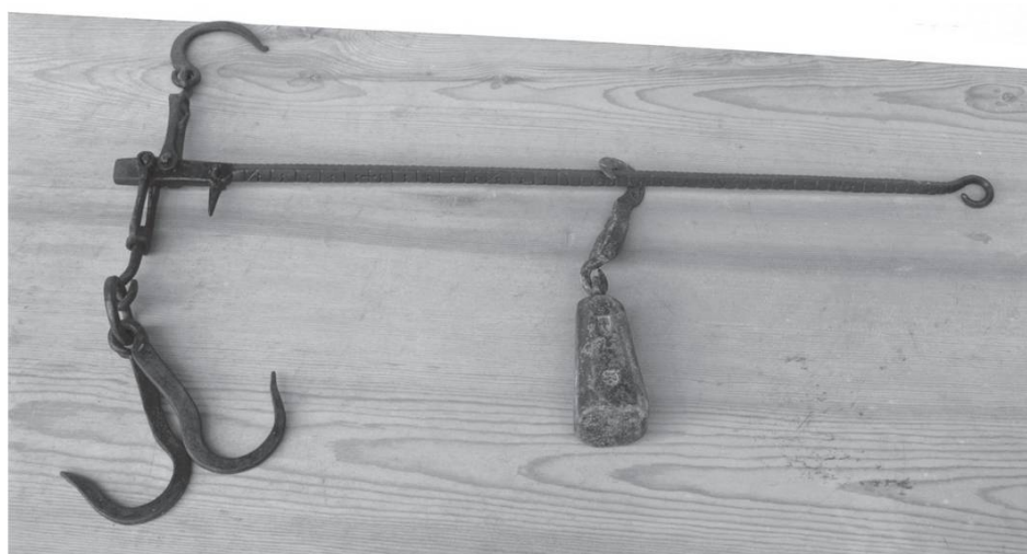
Vyu pèy , vieille balance romaine graduée en livres. Photo Anne-Marie Bimet, Savoie.

« Les racines du passé irriguent le présent pour faire fleurir l'avenir. »