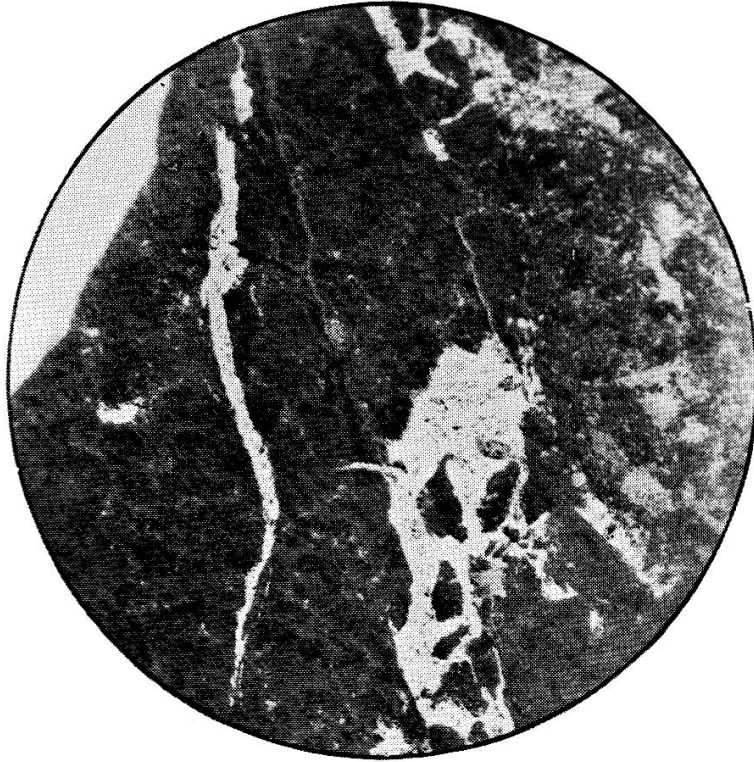
Microphotographie ( G = 12 \times ) d'une section polie d'un minerai de cuivre de Minduli (A.E.F.).