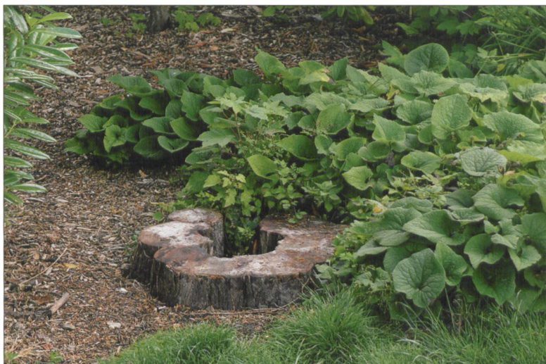
Fig. 5 : Habitat de Brachyopa panzeri Goffe, 1945. Souche de l'arbre devant le Muséum d'histoire naturelle.