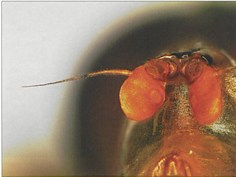
Fig. 3: Brachyopa panzeri Goffe, 1945. Mâle, antennes (GE: Genève, Muséum d'histoire naturelle, 11.V.2009).

L'identification des espèces du genre Brachyopa n'est pas facile, car elles se ressemblent morphologiquement et ne se distinguent que par des caractères difficiles à voir. Parfois, il est indispensable d'étudier l'appareil génital du mâle pour confirmer une identification. La première clé fiable a été présentée par Thompson (1980). Elle traite les 9 espèces suisses, mais 4 espèces décrites plus tard d'Europe centrale ( B. obscura Thompson & Torp, 1982; B. grunewaldensis Kassebeer, 2000; B. bimaculosa Doczkal & Dziock, 2004; B. silviae Doczkal & Dziock, 2004) manquent évidemment et il est nécessaire de les intégrer à la base des descriptions originales. Comme l'a démontré Thompson (1980), les noms de quelques espèces ont été attribués à des taxons différents par plusieurs auteurs dans le passé. Pour cette raison il n'est pas judicieux de se baser sur les publications anciennes. Des identifications fiables ne sont possibles que depuis la parution de la révision de Thompson (1980). B. panzeri est aujourd'hui connue dans quelques pays en Europe centrale et septentrionale (Allemagne, Autriche, Belgique, Danemark, France, Hongrie, Luxembourg, Pays-Bas, Pologne, République Tchèque, Roumanie, Russie, Slovaquie, Suède, et Suisse; voir Speight 2007; Speight 2008). Ainsi, B. panzeri a été signalée en Suisse par Schoch (1889), Ringdahl