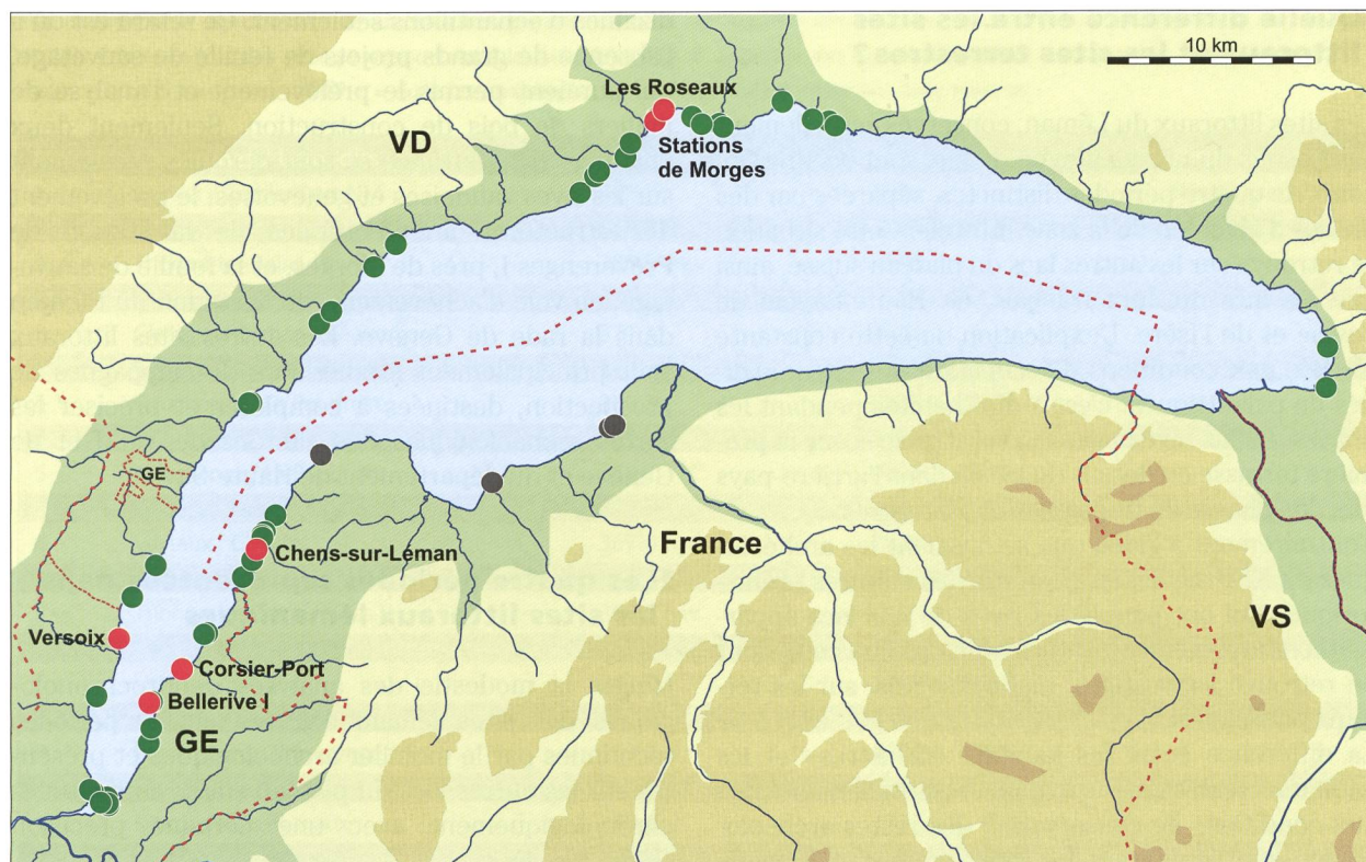
Fig. 2. Carte actuelle des 53 sites littoraux lémaniques identifiés, d'après les prospections et recherches menées entre 1976 et 2003. En rouge: sites classés au patrimoine mondial de l'UNESCO, en vert: sites classés associés, en gris: sites non classés.

aurait été «sacrilège» de le remettre en question (Forel 2012; Kaeser 1998). Ce n'est probablement pas un hasard si la première attaque sérieuse de ce mythe est due à un Allemand et non à un Suisse: Oscar Paret, qui dès 1946 réfute catégoriquement l'interprétation de F. Keller et en propose une nouvelle, basée sur les fluctuations lacustres (Paret 1946; Paret 1958).