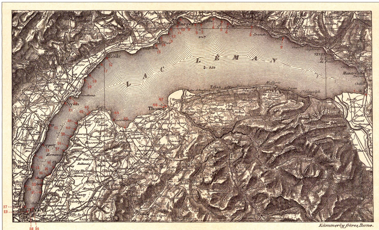
Fig. 1. Carte des 47 stations lacustres lémaniques, publiée par F.A. FOREL en 1904 dans le troisième tome de sa monographie «Le Léman».