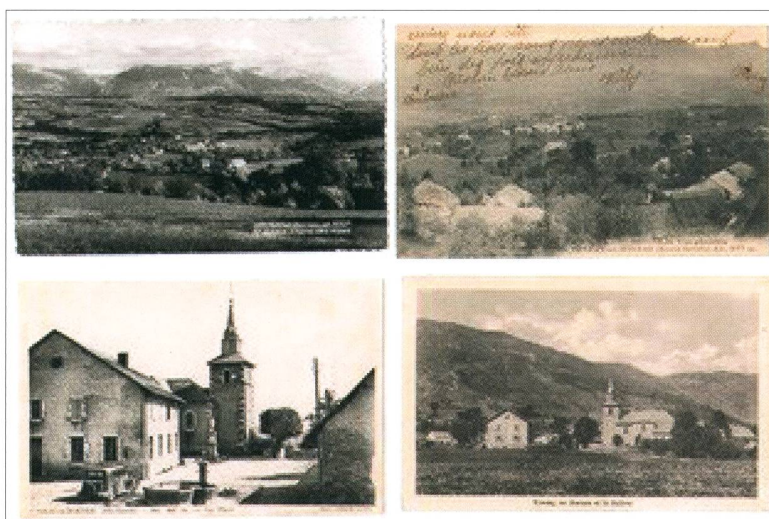
Fig. 3. Carte postale du chef-lieu de Vovray-en-Bornes au début du XX e siècle. Le centre du village, peu urbanisé, est composé de fermes éparses, de grands terrains, du cimetière autour de l'église (jusqu'en 1914).

Les « Dons de mémoires » font partie d'un processus de protection du patrimoine dans sa globalité, initié par La Salévienne. En récoltant la mémoire des anciens, un certain nombre de pistes se dégagent et seront exploitées. En enregistrant les témoignages, la connaissance est sauvegardée. Cela permettra de nous aider à établir des inventaires du patrimoine matériel visible, et de les ancrer dans leur histoire authentique grâce aux connaissances issues des té-