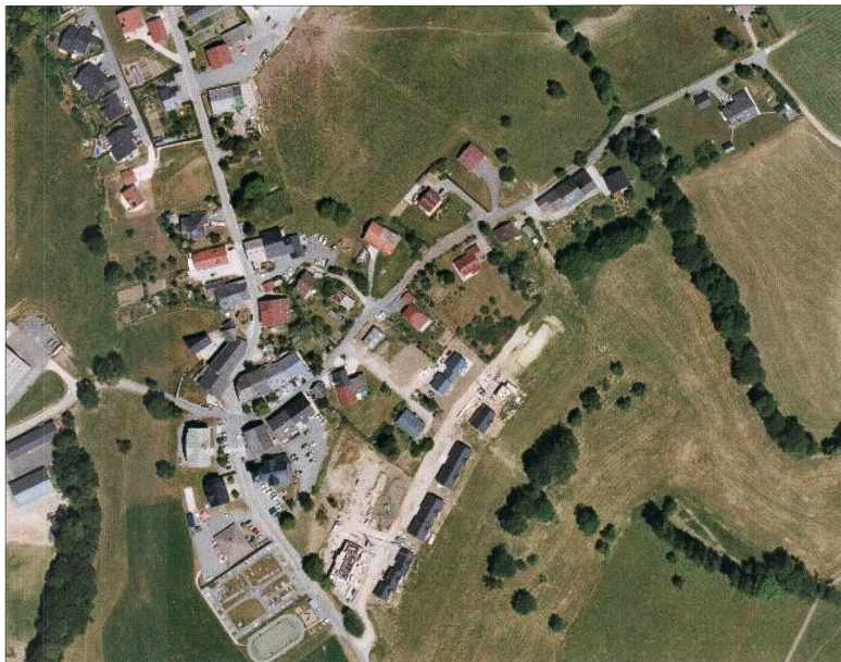
Fig. 4. Photographie aérienne du chef-lieu de Vovray-en-Bornes en 2015 ( www.geoportail.fr ). Des destructions et des aménagements sont survenus au XX e siècle, notamment Chemin de Vardon. Des nouvelles maisons ainsi que de nombreux collectifs ont été implantés au début du XXI e siècle : le « Hameau du Salève » aux toits gris et le « Pré de la Gusta », en construction, dont la route d'accès rogne dans les terres agricoles.

Tous les documents fournis sont scannés, sauvegardés de la même manière, et rendus à leur propriétaire. Nous essayons autant que possible de noter les noms donnés et les informations acquises.