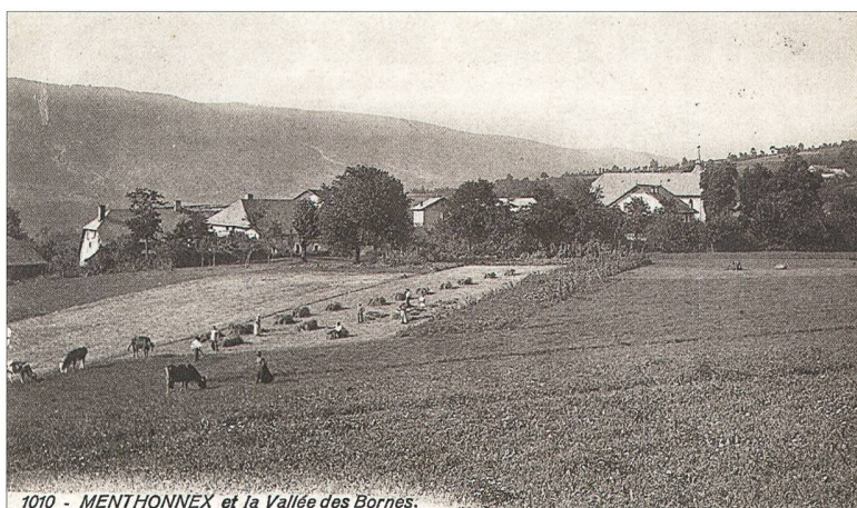
Fig. 1. Illustration du Salève en arrière-plan, du patrimoine bâti au second plan avec ses fermes, du patrimoine immatériel au premier plan avec les travaux des champs. Carte postale du fonds de La Salévienne.

Ainsi, dans le cadre d'un stage de Master Histoire-Patrimoine effectué en 2015 en partenariat entre