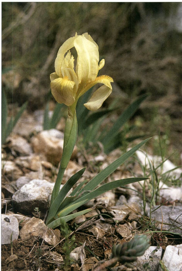
Fig. 2. Iris jaunâtre ( Iris lutescens Lam.) - P. Prunier.

Statut Protection: N – UICN Rhône-Alpes: EN – Fig. 3.