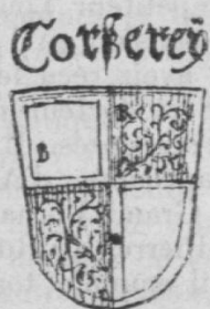
Fig. 19. — Les armoiries de Corserey d'après le plan de Fribourg de Martin Martini. 1606.

La position du bleu et du rouge n'est pas fixe ; sur certains documents on trouve le bleu au premier quartier ; sur d'autres, le rouge.