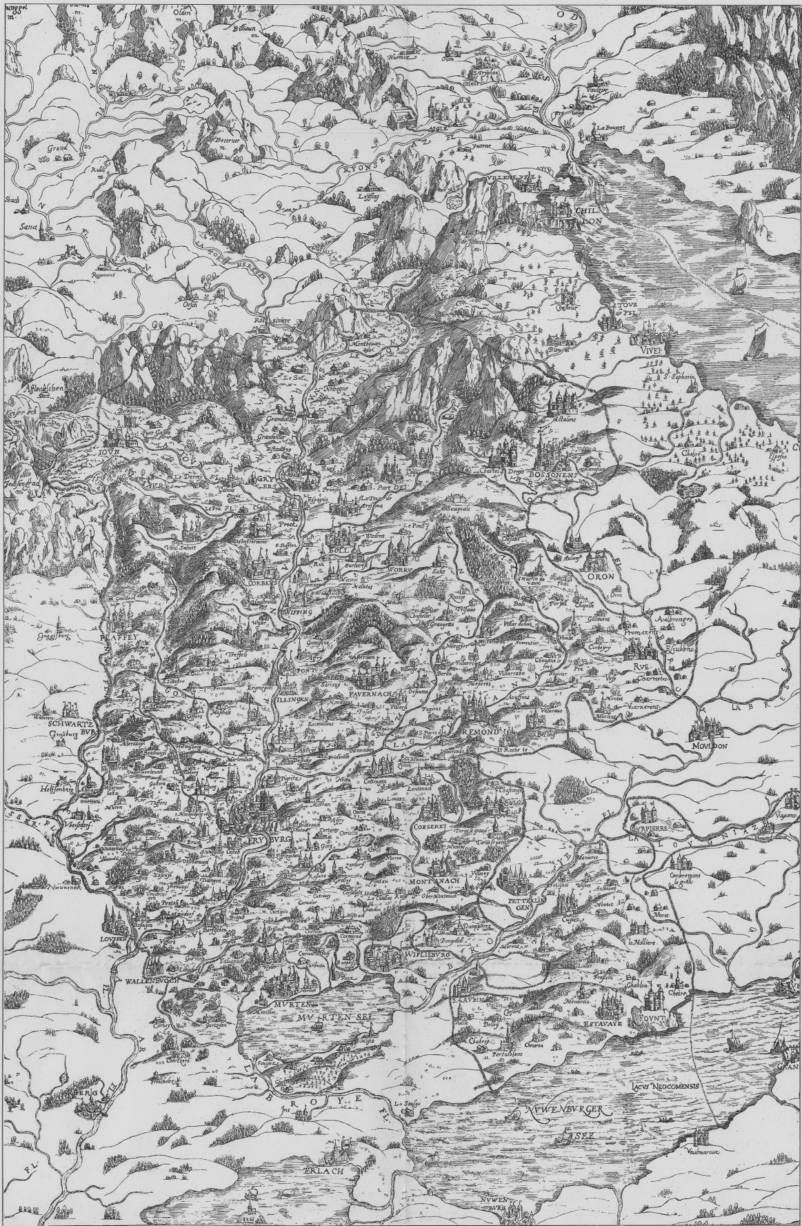
Fac-similé par A. Weibel, Novembre 1914