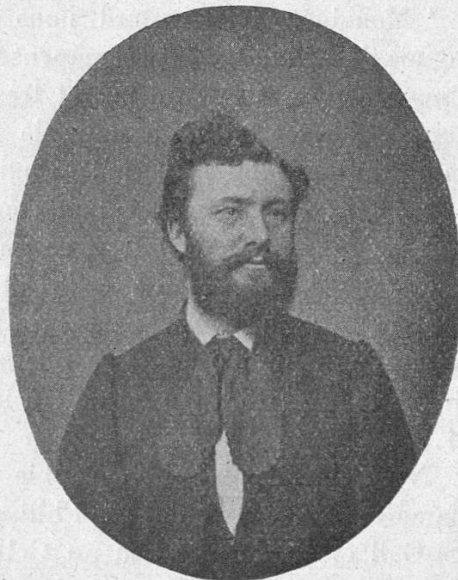
Léon Pugin, 1867.

pauvre émigré après 53 ans et 3 mois ! J'ai le cœur rempli de gratitude à ton égard. J'ai puisé dans ce fait la conviction incontestable et consolante que la postérité n'est pas toujours ingrate envers les gestes généreux.