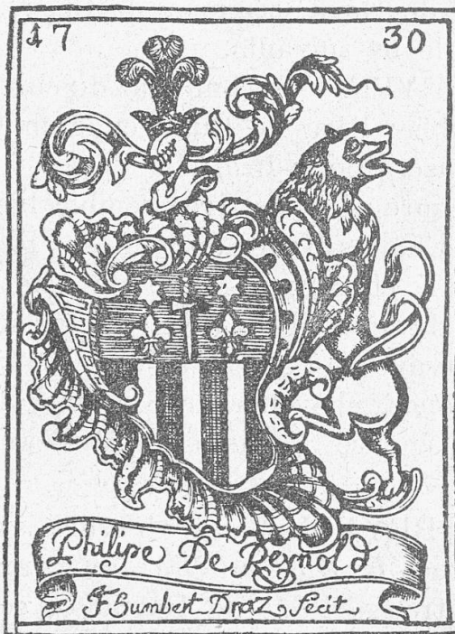
N o 114

N o 115. REYNOLD. — Gravure sur cuivre, signée F. B. , de 60×84 mm (60×86 signature y compris). Dans un encadrement, et sur une console et un cartouche, l'écu de Reynold : coupé d'azur à une croix trèflée accom-