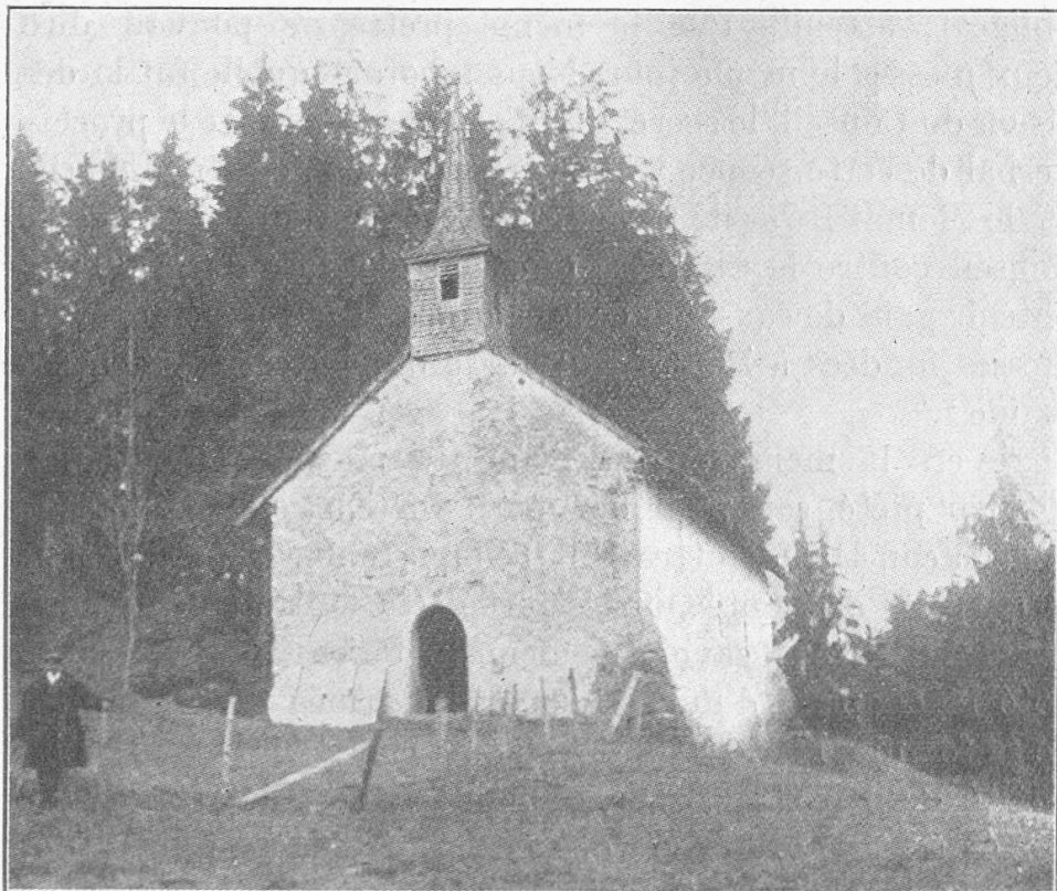
Chapelle de Pont, mars 1930.

pelle. Dans cette même séance, il obtint pour lui et pour sa postérité le droit de patronage de la chapelle à condition « qu'il maintienne à l'advenir et l'église en bon estat et les ornements et habits d'église en bon estre et que pour les réparements passés qu'il pourrait avoir payés, il n'en demande rien aux communiers, auxquels toutefois la dite